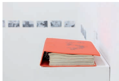
← La Galerie UQO présente ICI : Harald Szeemann, documenta 5 , vue d'exposition, Galerie UQO, Gatineau, 2017.