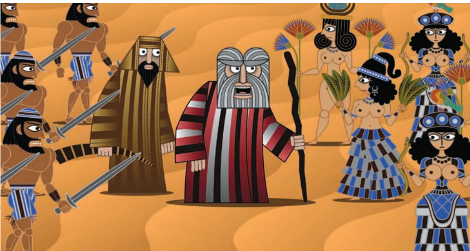
Nina Paley Seder-Masochism, captures vidéos | video stills, 2018. Photos : permission de l'artiste | courtesy of the artist