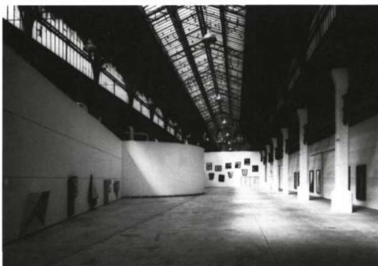
Ger Van Elk, De la nature des genres au Magasin à Grenoble, du 30 avril au 26 juin.

La série des natures mortes est un autre exemple de l'éventail d'appropriations que Van Elk met en scène afin de «trafiquer» la tradition — ou plus précisément pour suggérer une réactualisation de cette tradition. Les séries des Fleurs , sujet par excellence du genre hollandais, sont ici «sur-peintes» sur des cibachromes encollés sur aluminium dont la découpe du format évoque d'explicites distorsions. Dans l'apparent fouillis d'un expressionnisme souvent criard, se dissimule au fond de l'image un vase, des fleurs comme si Pollock, Johns, Klee ou De Kooning étaient tous passés par là. L'accrochage par étagement (à la manière de jadis) souligne les tensions perspectivistes que se renvoient les tableaux les uns les autres — comme pour faire coïncider une relation n'ayant qu'un seul et même sujet (floral), mais un éclatement aussi d'une variété d'écritures peintes. Cette réappropriation du sujet classique exprime d'une certaine manière le vent de pénurie de sujets avec lequel la peinture actuelle doit travailler. Par ailleurs, cet état de fait nomme également les possibilités de relectures, non plus «baroques» au sens où le péjoratif aurait dû tourner sa langue plusieurs fois, mais en tenant compte d'une avenue de synthèses où la peinture redouble de sens.