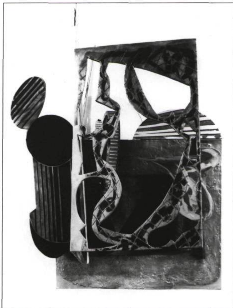
Frank Stella, The Lamp, 3x (Wave Series) 1987. Techniques mixtes sur aluminium; 246, 8 x 191,8 x 181,7 cm. Collection privée.

I l est impensable de faire de la peinture aujourd'hui sans connaître la démarche particulière que nous a livrée Frank Stella jusqu'à présent — pour la reconnaître ou même pour s'y opposer. En regard de ce canon de l'art américain qui a redéfini avec brio une pragmatique formaliste, pour lui-même et pour tout un arsenal théorique de la peinture, on doit forcément mesurer ses munitions et observer sous quel angle les ambiguïtés d'alors sont devenues les évidences d'aujourd'hui.