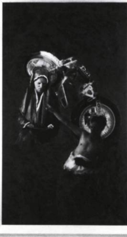
Ger Van Elk, Série «Portraits», Honda Gothic , 1986. Peinture, laque et vernis sur cibachrome encollé sur aluminium; 214 x 131 x 15 cm.

Tout juste à droite de la salle occupée par Buren, l'artiste d'origine hollandaise Ger van Elk introduit un