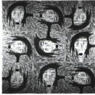
Gabriel Routhier, Zone sourde pour Baselitz , 1991. Bois gravé

7 janvier 1991 - 31 janvier 1992 : Artistes de la galerie et estampes européennes