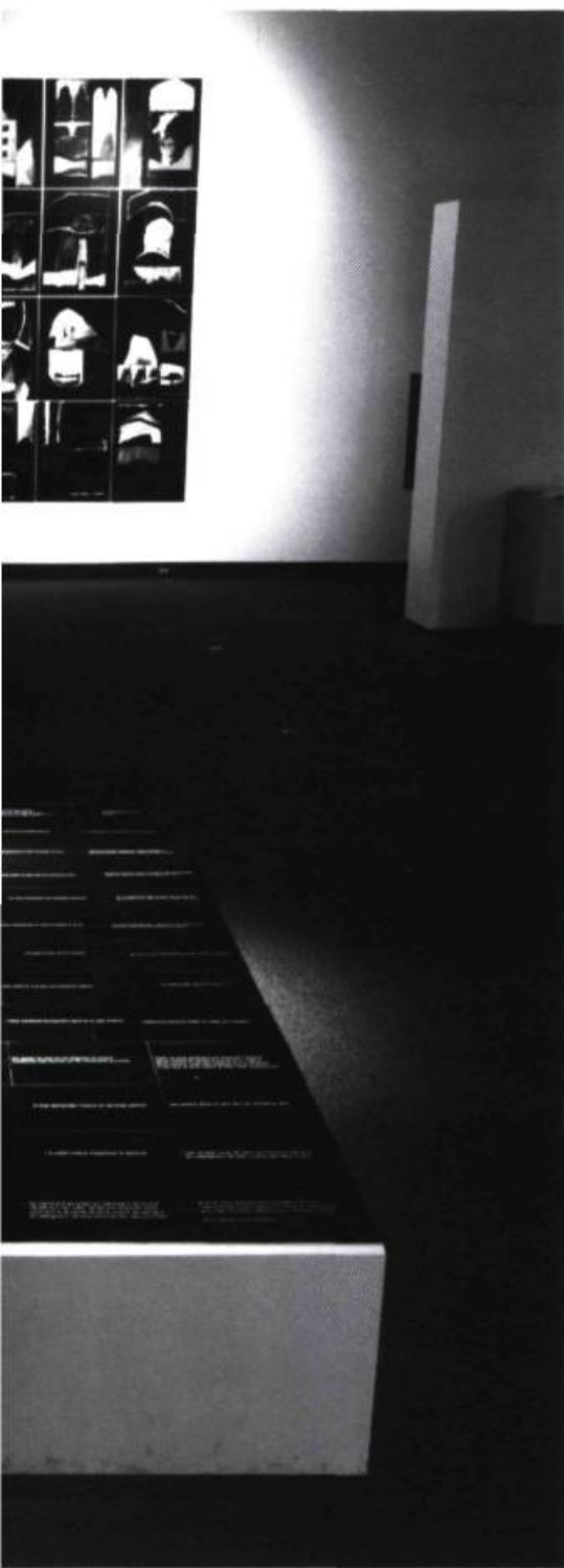
Hélène Roy, Chants secrets/Écrits d'écho , 1994. Composition murale de 29 fragments.

L'humanité se relèverait des périodes de nihilisme. Le collage, principe fondateur de cette recherche, réorganise le puzzle d'un nouvel horizon. On tend vers quoi ?