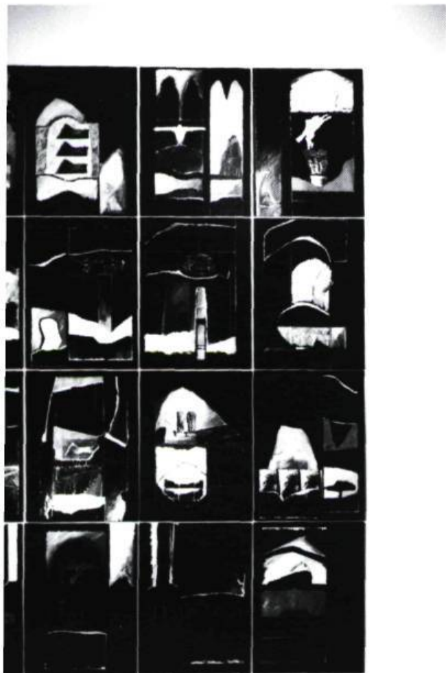
Hélène Roy, Chants secrets/Écrits d'écho , 1994. Composition murale de 29 fragments.

les plus minimalistes. Chez Hélène Roy, se manifeste plus qu'un nettoyage de la mémoire et, même si elle s'en défend, une réelle mutation des valeurs spirituelles, via la