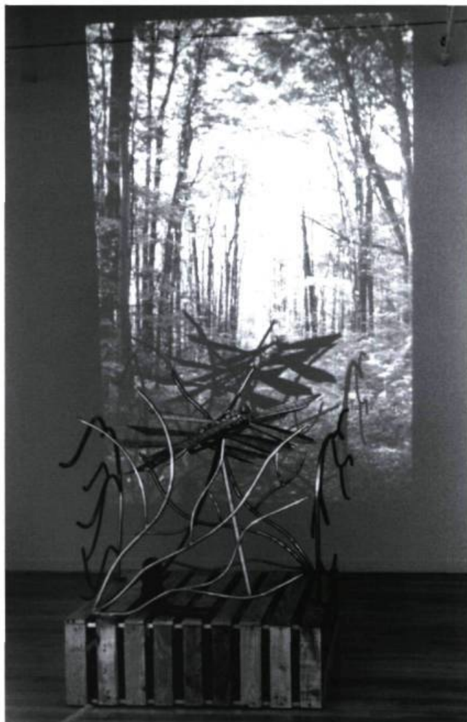
Joëlle Morosoli, Carcan de plumes , 1996. Diapositives, aluminium, corde, bois, cuivre, moteur. Sculpture : 100 x 100 x 130 cm; environnement : 300 x 300 x 300 cm.

Cette Déchirure ne montrerait-elle pas, elle aussi, tel que l'Allemagne de 1989 le symbolise, la construction idéologique du monde actuel, qui n'est plus interprété suivant la bipolarité gauche-droite, communiste-capitaliste. Le concept politique est bel et bien morcelé en une multitude de gauches et de droites teintées de la couleur de chaque interprète des structures sociales. Pièces-Pièges communique de façon directe au visiteur qui s'introduit à l'intérieur des exiguës pièces installées, les sensations d'enfermement et d'incommunicabilité auxquelles se réfère Morosoli.