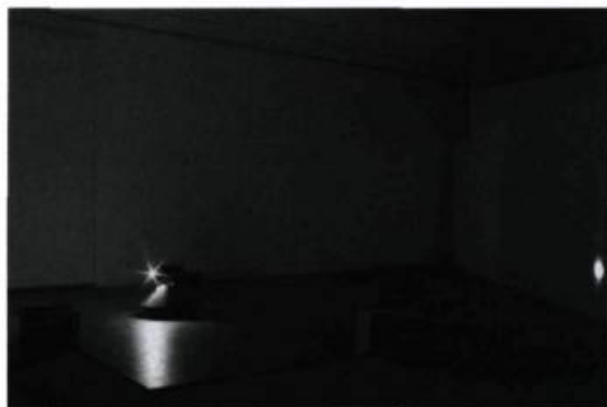
Robert Saucier, Réciter le campas , 1998. Moteurs, lampe, lecteur DC, haut-parleurs, détecteurs, acier, bois. 400 x 400 cm au plancher.