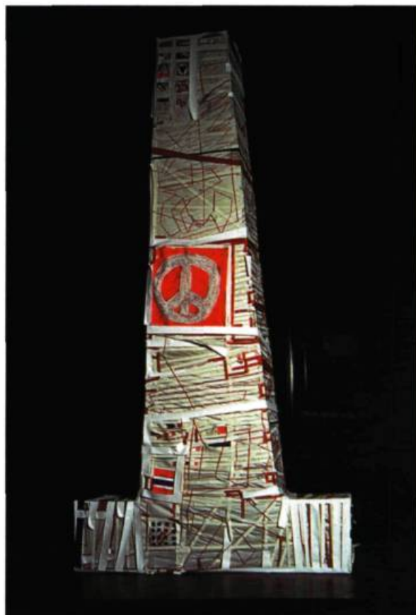
Serge Lemoyne, Armenik , 1970. Matériaux divers; 351, 7 x 184, 3 x 48 cm. Coll. MACM.