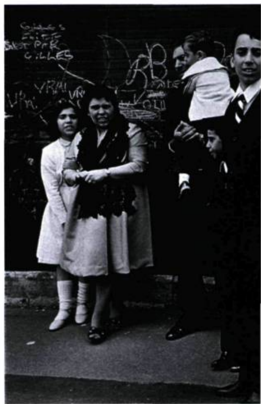
Michel Campeau, Fête religieuse portugaise , Montréal, 1980. Épreuve argentique; 40, 4 x 50,4 cm. Coll. MACM.