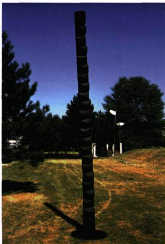
Armand Vaillancourt, Justice aux indiens d'Amérique , 1957. Pin, socle en acier; 367, 8 x 20, 3 cm. Diamètre du socle: 70 cm 4. Coll. MACM.

Une exposition-bilan de l'activité artistique des années 1960 et 1970 au Québec, présentant 225 œuvres réalisées par 90 artistes.