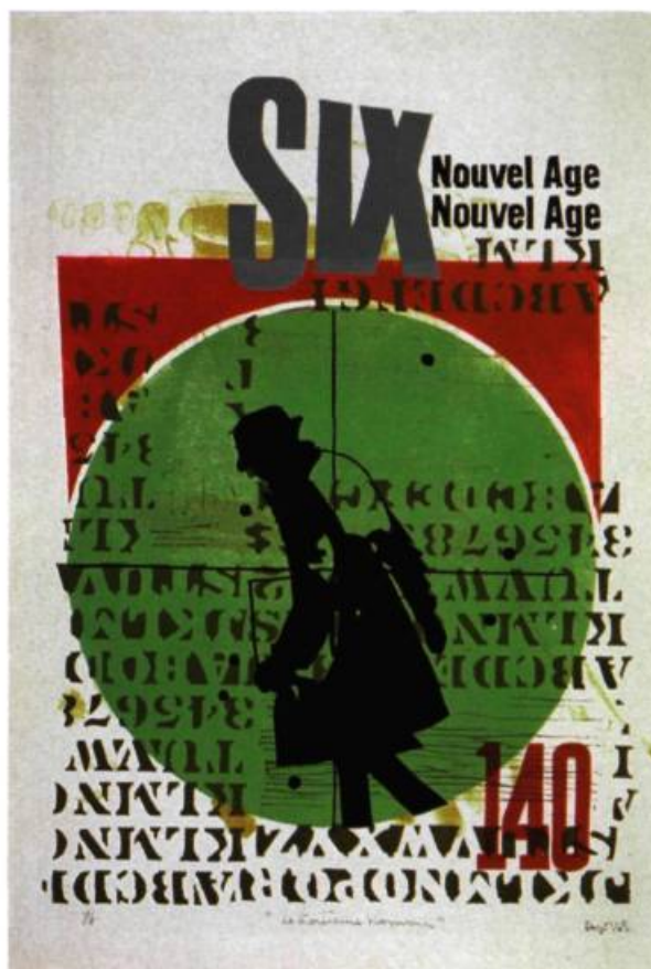
Pierre Ayot, Le troisième homme , 1965. Lithographie et linogravure sur papier Arches, 7/8; 56, 4 x 38, 2. Coll. MACM.