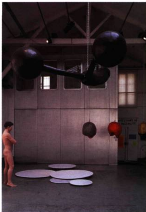
Expand 1, Atelier Van Lieshout, The Pitiful One, 1996, + Sensory Deprivation Helmets, 1999. Galerie Roger Pailhas, Marseille. Xavier Veilhan, Les Machines Tournautes, 1995, Galerie Jennifer Flay.