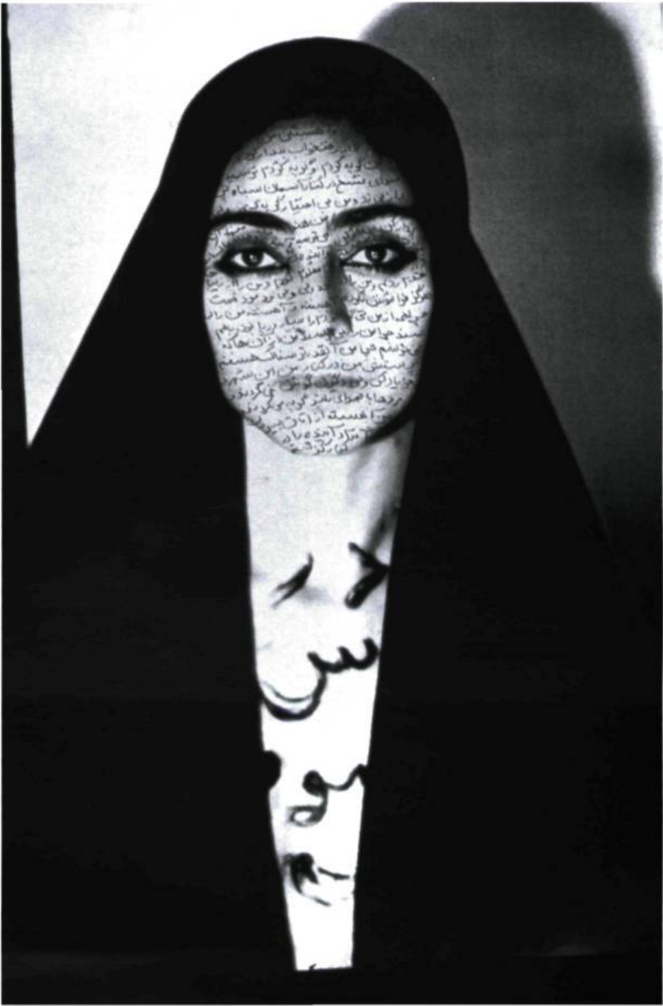
Shirin Neshat, Unveiling (séries Women of Allah ), 1999. Photographie en noir et blanc, 101, 6 x 152, 4 cm. Édition de 3 + 1 épreuve d'artiste.

tions vidéographiques de Shirin Neshat proposent une expérience émouvante, de l'ordre du sublime. Et s'il fallait donner un sens, une fonction à tout cela, je terminerais par ces quelques mots de É. Souriau : « ... le sublime manifeste... une perfection plus haute qui le métamorphoserait... un statut supérieur accessible à celui qui en reçoit l'impression. » 7