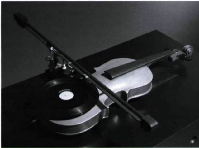
Laurie Anderson, The Viophonograph , 1977.