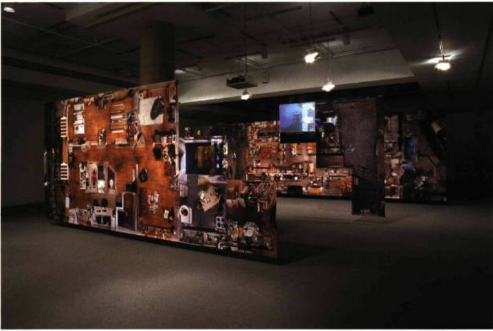
Alain Paiement, Parages , 2002.

montrant dans l'image en mosaïque. Avec la série de Refaire surface commence réellement le rapport de position en plongée, le regard partant d'un angle de 90° fondant littéralement sur la chose photographiée, dont F3 (Living Chaos, 2000-2001) offre l'exemple le plus élaboré.