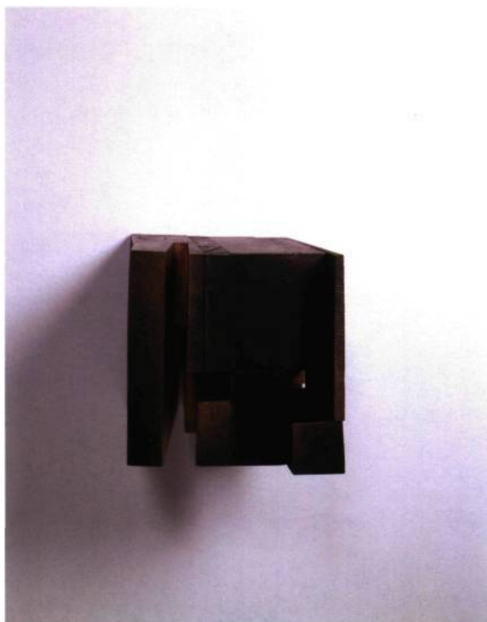
Roland Poulin, Demeure n° 7 , 2002. Bois polychrome; 19, 5 x 19 x 23, 5 cm. Collection de l'artiste.