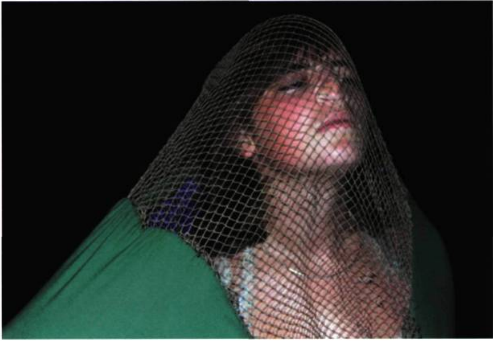
Majida Khattari, Les Mille et Une Souffrance de Tchadiri , n° 7, 2001.