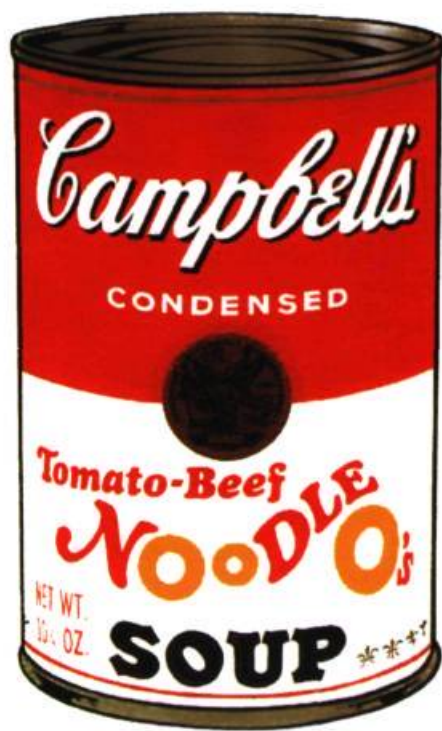
Andy Warhol, Tomato-Beef Noodle O's , 1969. Collection d'art de l'University of Lethbridge.