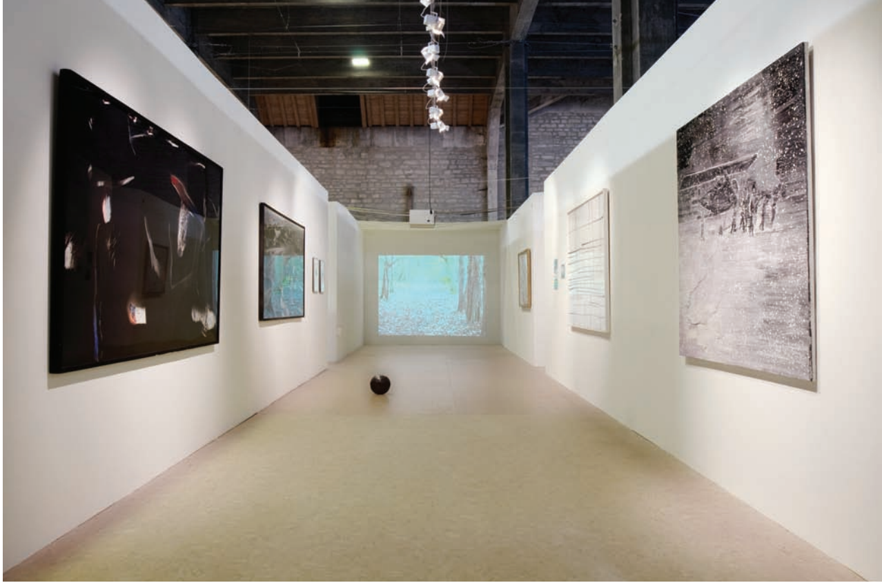
Aurélien Mole, exposition 90', galerie Sans Titre.

fictionnel du display . Dans la « galerie des archives », la direction des néons a été changée, au lieu d'une grande bande traversant la galerie, ils ont été placés perpendiculairement comme dans des bureaux.