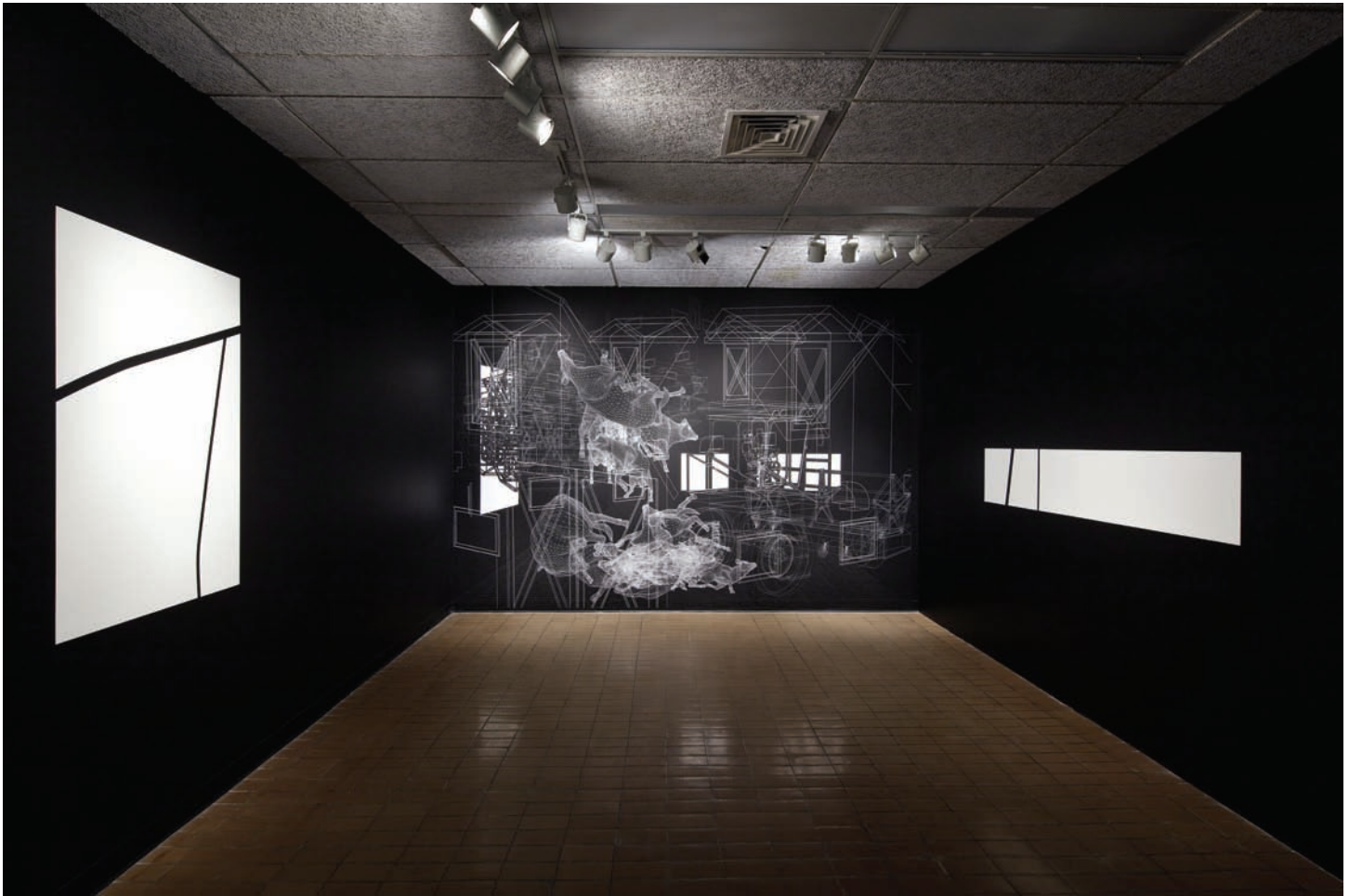
Michel Boulanger, Grand retournement , œuvre synthétique.

sinistrée – des squelettes agro-industriels qui s'enjambent, s'agglomèrent dans un désordre unifiant d'une grande précision de trait. Une sorte de « bucolisme » vectoriel domine et submerge à la fois. Ces motifs de tracteurs et de silos reviennent couramment dans la production de Boulanger, telle une hantise mnémotechnique ou vectorielle. Cette obsession a comme fondement une double fascination : celle de l'ingénierie – les capacités de production dont émane une sorte de beauté inquiétante – et celle de la nature romantique. Ces deux-là se fondent dans un romantisme postindustriel cartésien qui, sans être dénonciateur, se contemple et s'assume. Dans la seule œuvre dessinée au mur, Manœuvre saisonnière , l'artiste revisite les chemins de la formation des images et le rôle de celles-ci dans notre définition de la réalité, ce qui, d'un point de vue platonicien, nous renvoie à un monde d'idées d'où l'on extrairait les premiers traits du dessin. Une sorte d'anamnèse, une reconnaissance par le ressouvenir. Nous décelons les marques de structure d'une vache, les contours décomposés d'un tracteur qui « congédie » le dessin et, en même temps, le ramène à ces gemmules qui, à leur tour, vont faire entrevoir les tiges du dessin. Il y a une certaine latence, à la fois féconde et porteuse