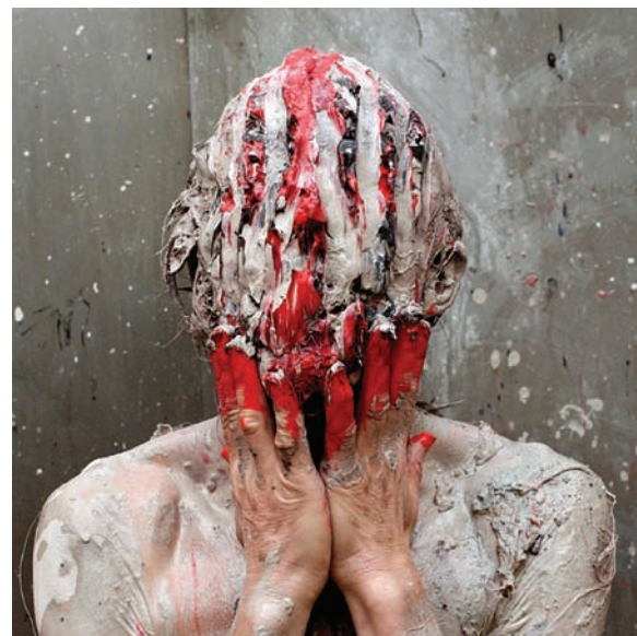
Olivier de Sagazan, Corps défigurés