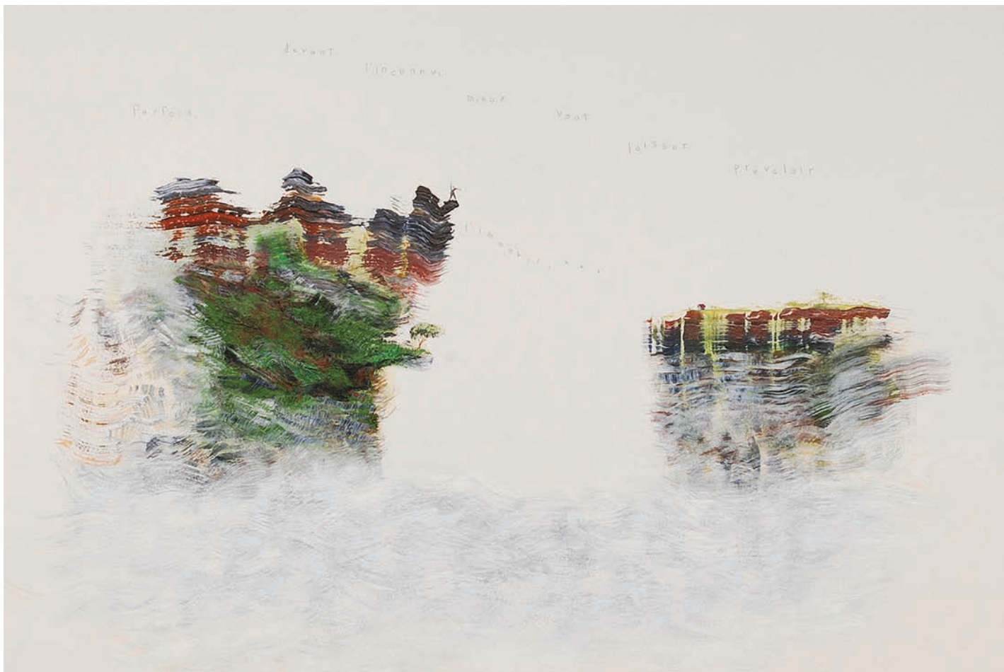
Martin Désilets, Études pour un aphorisme # 1 , 2009. Acrylique et crayon de plomb sur papier ; 76 x 105 cm.

se montre comme un amalgame de petits carrés noirs où l'on distingue quelques traits de différents visages humains. Mais l'installation Portraits pétris force le spectateur à s'attarder aux différents détails de chacun des portraits – il y en a une centaine – permettant ainsi de voir une mosaïque où la particularité physique de chacun des visages s'articule de manière subtile mais efficace, d'où le minimalisme accrocheur de l'œuvre. Cette pluralité de portraits apposés sur le mur de manière concentrée en son centre et dispersée sur les côtés est également intéressante en ce sens qu'elle donne l'impression que l'œuvre est inachevée et pourrait grandir de plus en plus avec l'ajout d'autres portraits. Se distinguant de la série de Lucie Robert Overall / Underall , Renée Lavaillante utilise des matériaux conventionnels, mais sa technique à l'aveugle permet de la singulariser à travers la multiplicité des œuvres que présentait l'exposition. Si le constat de Réal Lussier proposait d'élargir la conception du dessin contemporain, certaines œuvres semblent plus difficilement s'y rapporter. C'est le cas de Pamela Landry et de sa série Frottements . L'artiste présente de petites œuvres où se superposent formes géométriques, taches colorées et dessins de mains dans différentes attitudes. L'élément