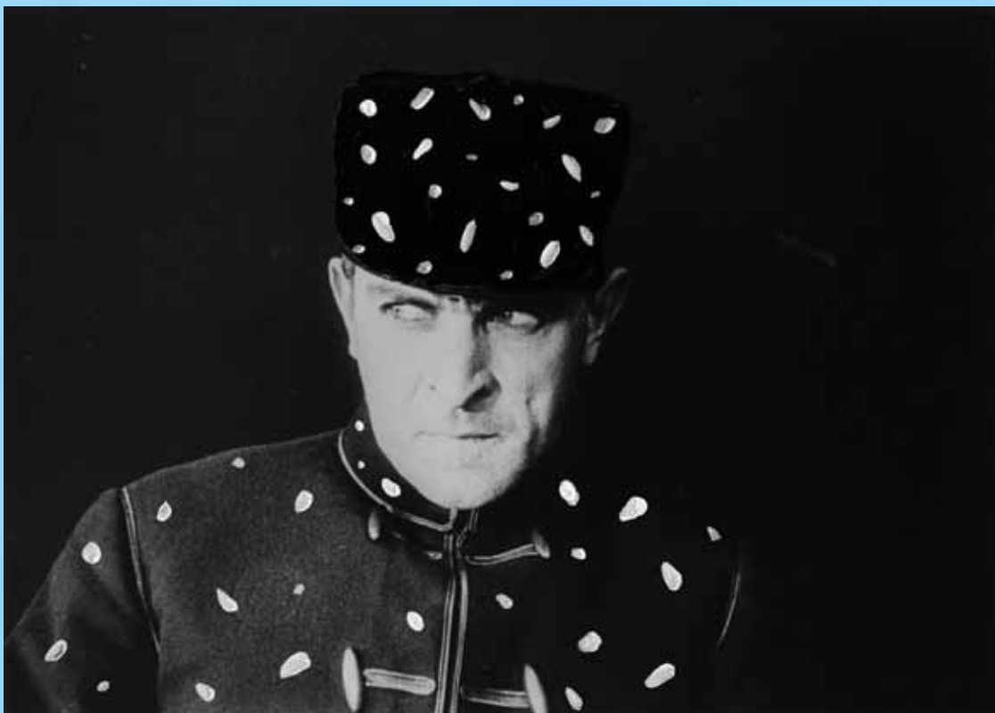
Capitaine Lonchamps, Neige, technique mixte sur photographie NB vintage (Fantômas, Louis Feuillade, 1913), 18 x 24 cm, 2011 (collection privée).