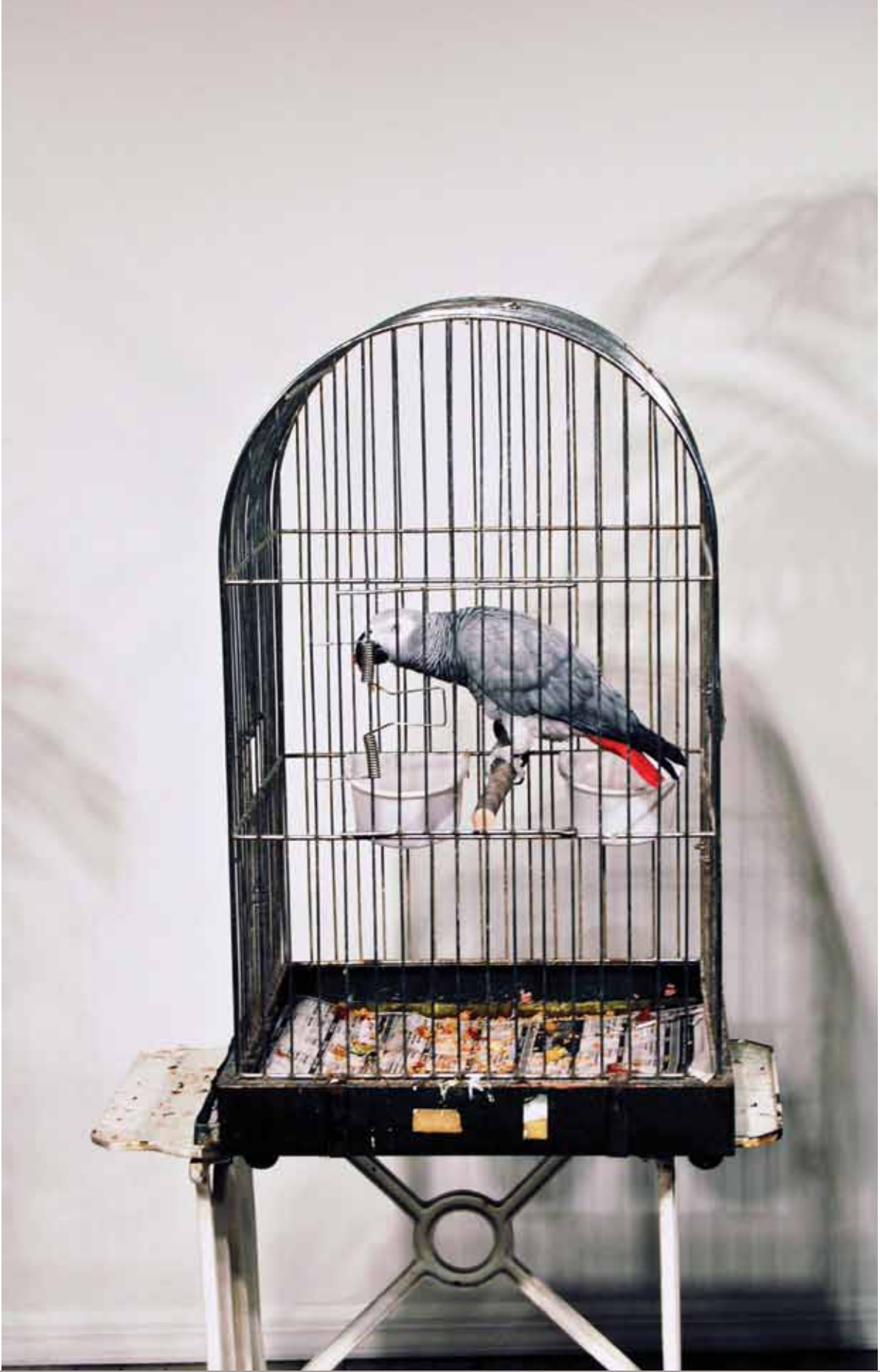
Marcel Broodthaers, Ne dites pas que je ne l'ai pas dit - Le Perroquet, 1974 .