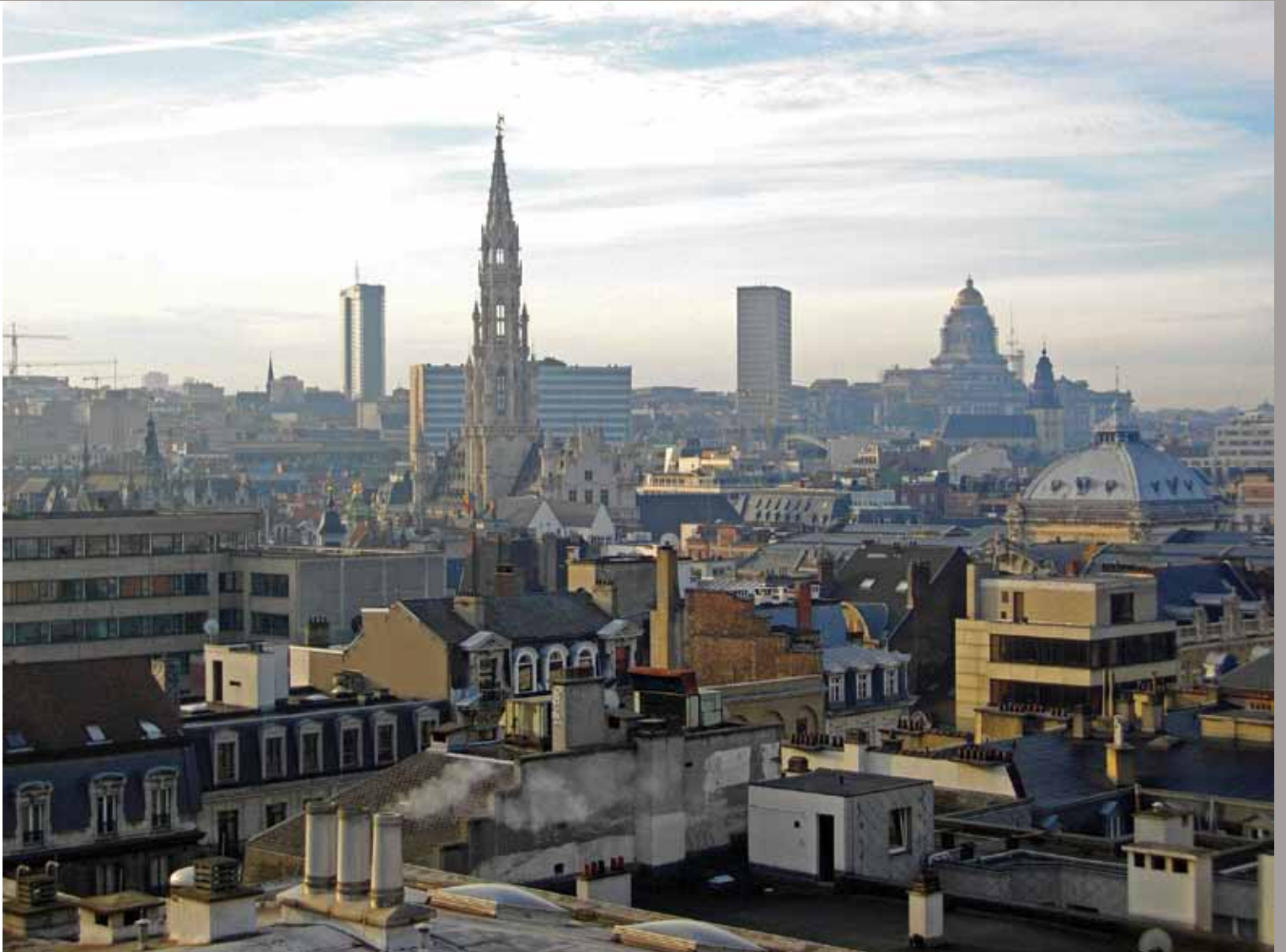
Parking 58, projet dans l'espace public bruxellois, sous commissariat d'Emmanuel Lambion.