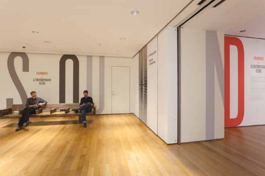
Mise en exposition de Soundings : A Contemporary Score , Museum of Modern Art, New York, 2013.