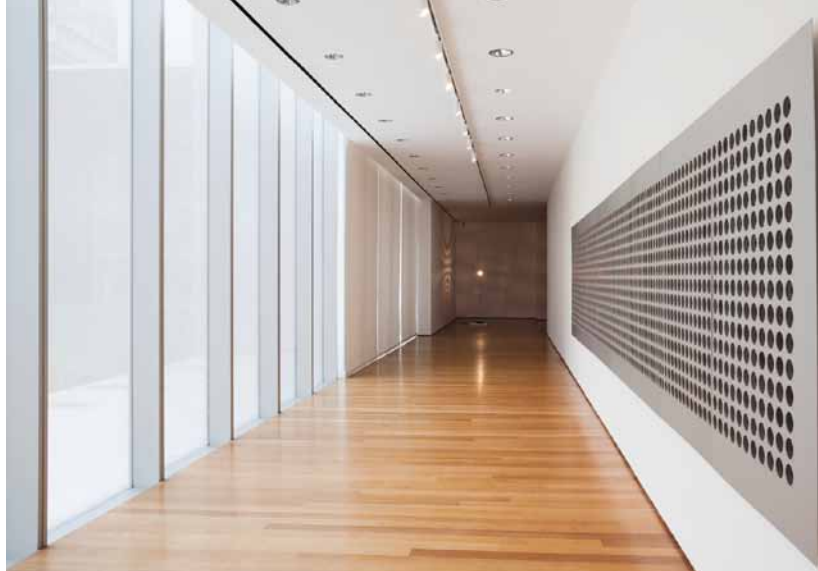
Tristan Perich, Microtonal Wall , 2011. 1,500 1-bit speakers et microprocesseurs, aluminium.