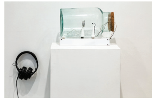
Adam Basanta, Vessel 2 , 2015.

La première pièce présentée est sans doute celle qui donne son nom à l'exposition. À moins, évidemment, que ce ne soit l'inverse. Il s'agit de sept haut-parleurs dépouillés, simples cônes tournés vers le haut, disposés en rond autour d'un micro monté sur un trépied dont le bras est orienté de manière à pointer vers les haut-parleurs. Comme ce dernier dispositif est monté sur un piédestal animé par un moteur lui donnant un mouvement de rotation, il vient un moment où le micro se trouve à pointer directement vers un des haut-parleurs. Ce changement constant et mesuré de position en vient donc à créer des tonalités sonores, variables au gré des passages devant les haut-parleurs. Neuf rotations complètent un cycle au cours duquel on entendra une version