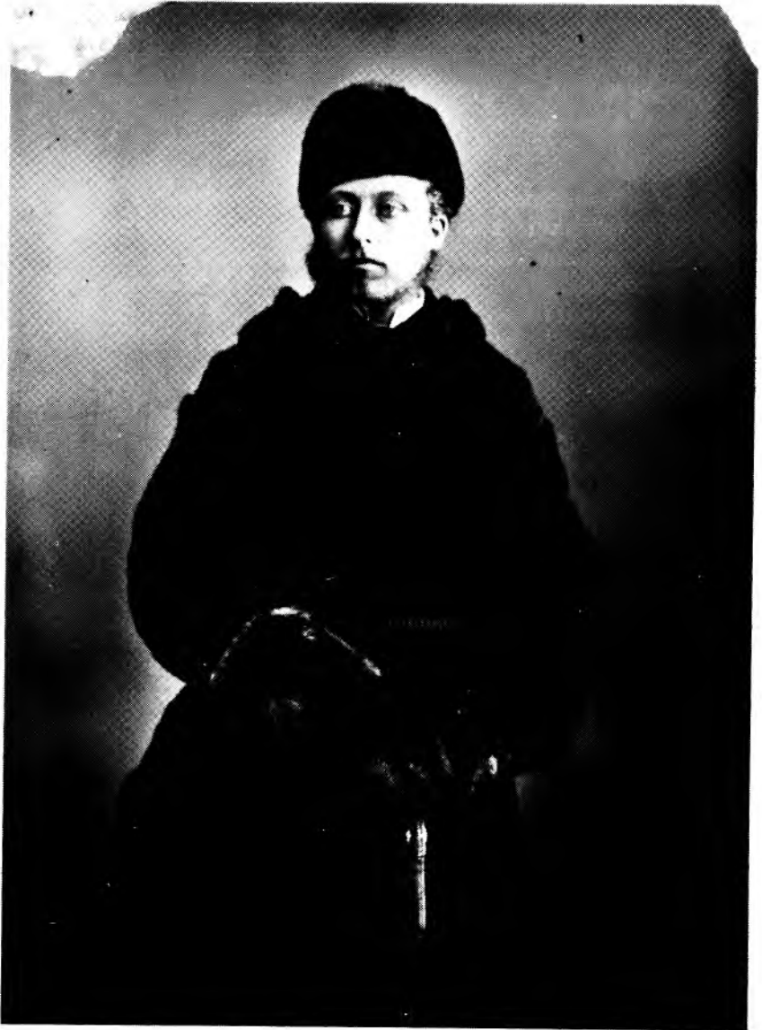
Figure 6: Le Duc de Connaught, gouverneur général du Canada, tel que photographié par l'atelier Notman en 1870. Ce dignitaire a revêtu pour l'occasion un costume "à la canadienne" composé d'un capot de grosse étoffe serré à la taille par une ceinture tricotée. Il est coiffé d'un bonnet de loutre et ses mains sont enmitoufflés par de volumineuses mitaines de peau d'ours.