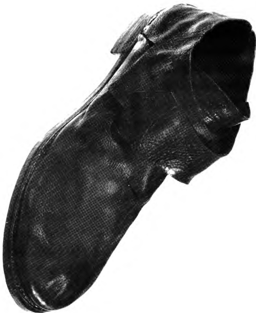
Figure 2: Voici une des quelques cinq cents chaussures provenant de l'épave du Machault, navire français coulé à Restigouche le 9 juillet 1760. Cette chaussure est un bon exemple du modèle de soulier porté tant par les civils que par les militaires au milieu du XVIII e siècle.