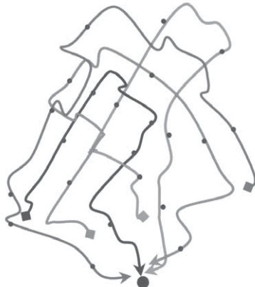
Figure 2 : Des parcours jalonnés de lieux investis quotidiennement.

— le parcours quotidien parsemé de places, de jardins, de magasins et de trottoirs chargés de sens pour les acteurs ;