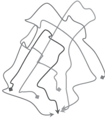
Figure 1 : Entrecroisement des parcours quotidiens au sein de l'espace urbain.

La chaîne des opérations spatialisantes semble donc prendre des références à ce qu'elle produit (une représentation des lieux) ou à ce qu'elle implique (un cadre local). Pour Michel de Certeau, on a ainsi la structure des récits de voyage, mais également, plus largement, de tout autre récit de vie, même si, pour lui, tout récit est un récit de voyage où « des histoires de marche et des gestes sont jalonnés par la citation des "lieux" qui en résultent ou qui les autorisent » (1980 : 212). Car il importe en effet de mettre en relation ces itinéraires avec les lieux qui les composent. Dans notre cas, il faut relever deux types de parcours jalonnés par des lieux de référence :