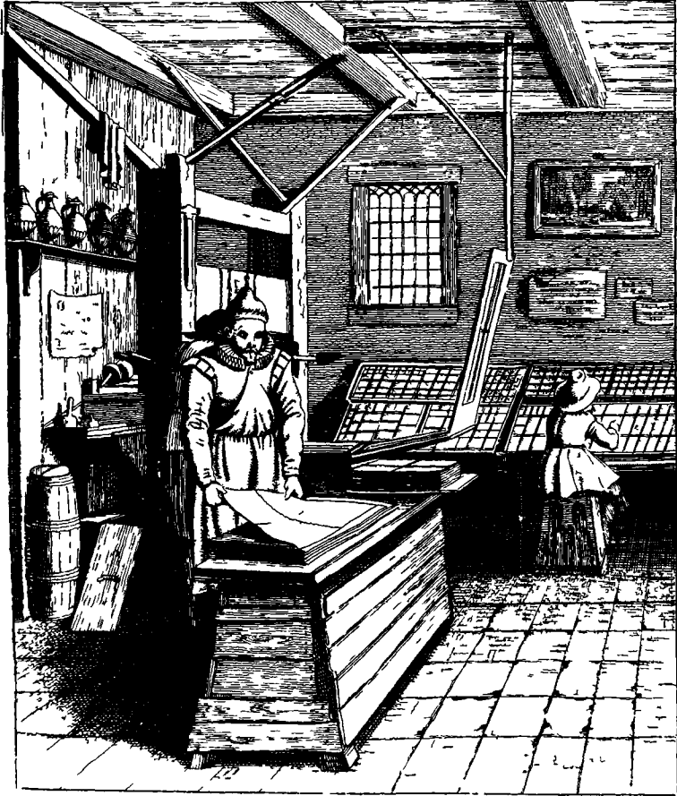
Gravure de J Van Velde d'après l'œuvre de P Saenredam de l'intérieur d'un atelier d'imprimerie selon Beschryvinge ende lof der stad Haarlem , de S Ampzing Haarlem, 1628 ( St Bride Printing Gallery )