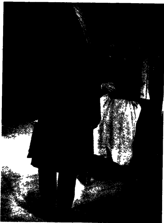
commentaire de Roland Barthes. (Bertold Brecht, Mère Courage et ses enfants , Paris, L'Arche éditeur, 1957, p. 209-210).

V OICI des photographies de théâtre qui ne sont nullement apprêtées. Ce sont en quelque sorte les moments d'un film que Pic a pris au télé-objectif pendant l'une des représentations que le Berliner Ensemble a données à Paris en 1957.