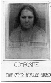
FIG. 2. Portrait composite, « Group of Irish high school students »

(l'identification), le sujet se transforme — pour reprendre Jean Baudrillard — en objet-signé 14 .