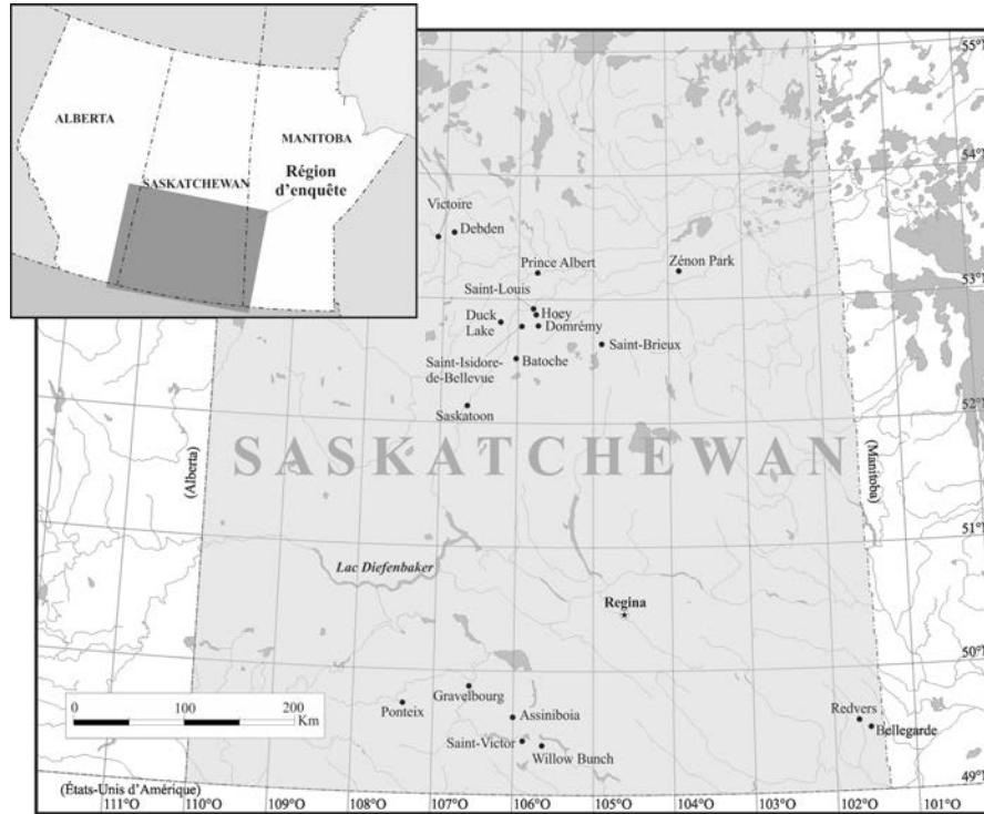
Figure 2 Points d'enquête en Saskatchewan