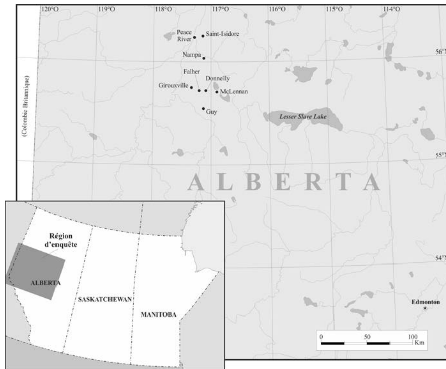
Figure 3 Points d'enquête en Alberta