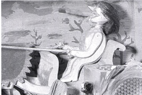
La charrette de la mort