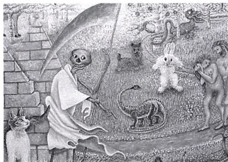
Adam et Ève chassés du Paradis Terrestre