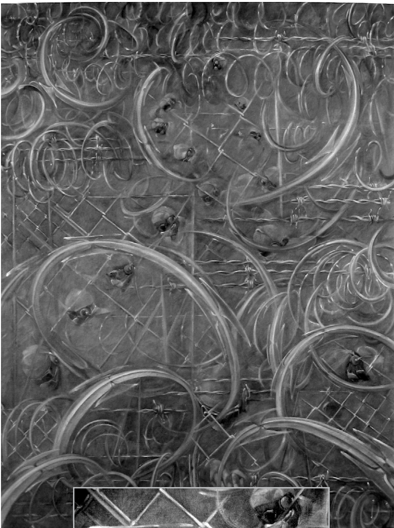
Michèle Lepezer, Guantanamo (2006), huile sur toile, 130 x 97 cm.