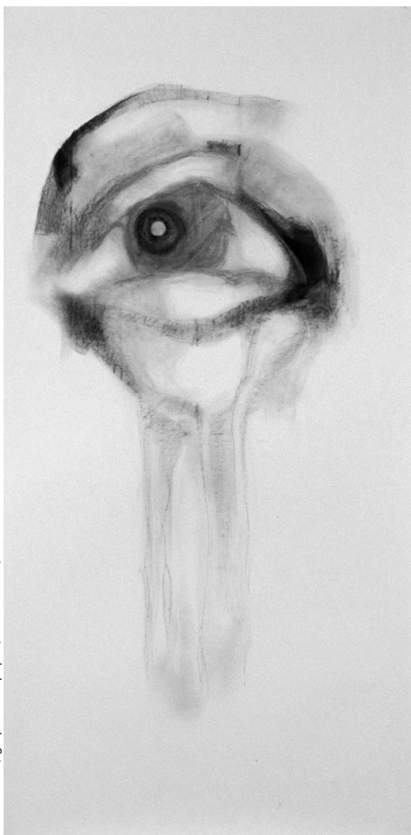
Lacrimae 481, graphite sur papier, 120x240 cm, 2004.

psychotropes pour des usages élargis pose la question de l'identité de la personne et de la normalité des comportements socialement attendus » (p. 96). En s'introduisant ainsi dans notre mode de vie, les médicaments psychotropes nous obligent à repenser notre capacité d'améliorer qui nous sommes et comment nous le devenons.