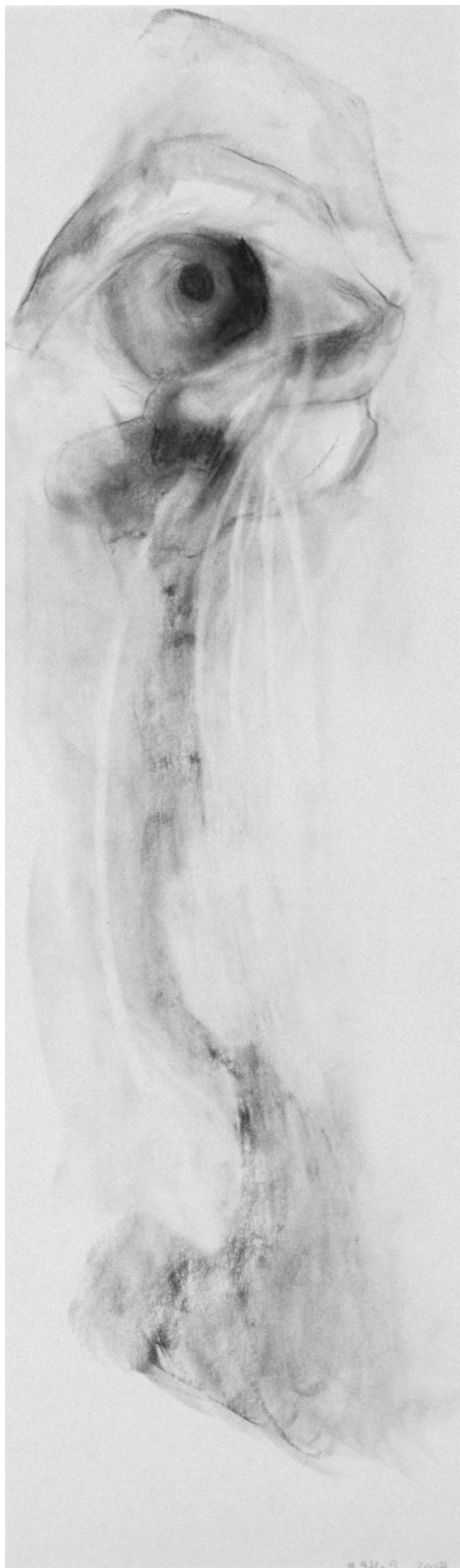
Lacrimæ 476.9, graphite sur papier, 12x38 cm, 2003.

Assis sur les marches de l'entrée d'un centre jeunesse, ce jeune contrevenant fume une cigarette en se rappelant le visage des huit intervenants qui ont défilé cette année-là devant lui, l'un après l'autre, lui promettant d'être une personne-ressource. Il se dit à lui-même que seuls ses clopes et ses Effexor ne l'ont pas laissé tomber.