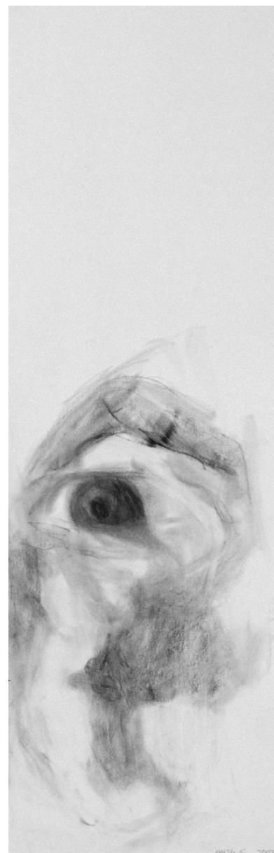
Lacrimæ 476.15, graphite sur papier, 12 x 38 cm, 2003.