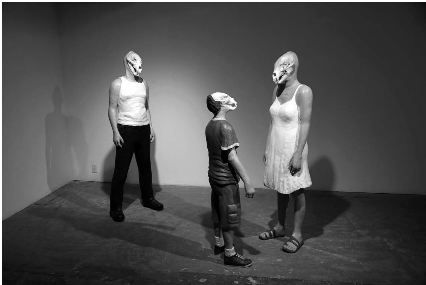
Jean-Robert Drouillard, Le Père , 2010, acrylique sur tilleul et résine d'époxy, crâne d'ours noir, 169 x 46 x 30 cm ; La Mère et l'Enfant , 2010, acrylique sur tilleul et résine d'époxy, crâne d'ours noir, 163 x 36 x 27 cm, 132 x 41 x 19 cm.

Notre hantise de la chair putréfiée, où la rigidité du cadavre est « animée » des nuées d'insectes et des parasites qui grouillent dans tous les orifices – un « ver de cercueil » peut sauter 90 fois sa taille – se thématise particulièrement dans les films de zombies, qui précisément répondent au patron stylistique de l'adynaton, la figuration de l'impossible : ils marchent, agissent, tout en se défaisant sous nos yeux ! Ils conjuguent donc deux horreurs : celle du corps sans sépulture qui promène parmi les vivants