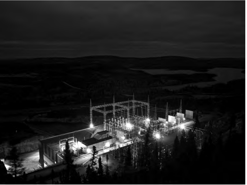
Thomas Kneubühler, Under Currents (Power Station) , 2011, épreuve à développement chromogène, 68 × 101 cm. Avec l'aimable permission de l'artiste.