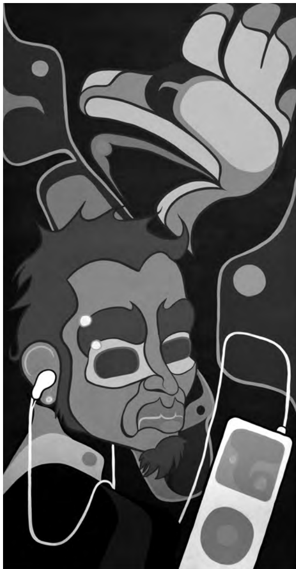
Sonny Assu, iPotlatch Ego , 2007, acrylique sur panneau, 61 × 122 cm. Avec l'aimable permission de l'artiste.