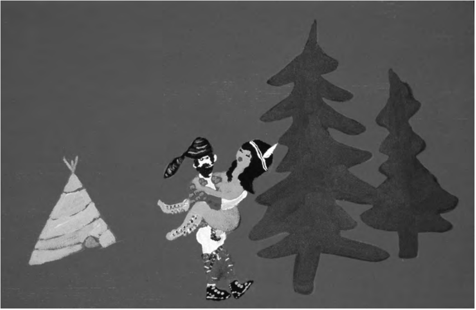
Cynthia Girard, Filles du roi/Filles de joie (détail) , 2002, acrylique sur toile, 216 cm × 184 cm.