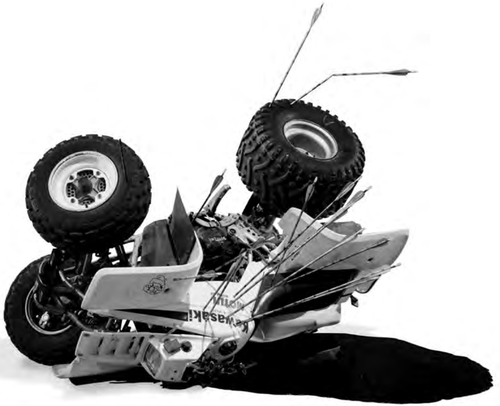
BGL, Jouet d'adulte , 2003, véhicule tout-terrain d'occasion, flèches, bois, peinture, 115 × 110 × 170 (approx.). Avec l'aimable permission des artistes et du Musée des beaux-arts de Montréal.