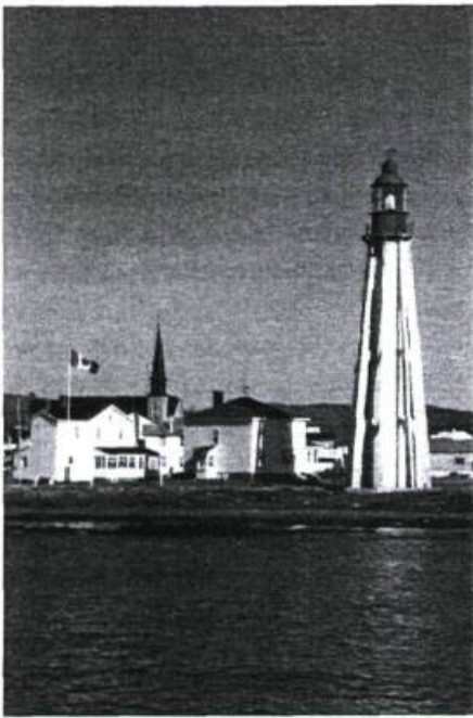
Le phare De Pointe-au-Père.