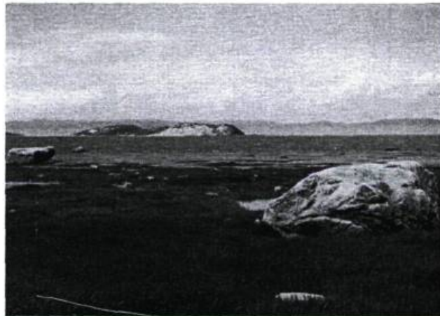
Le fleuve Saint-Laurent vue de Notre-Dame-du-Portage.

À quelques kilomètres du fleuve, à mi-chemin entre Kamouraska et Saint-André, le petit village de Saint-Germain semble veiller sur le Saint-Laurent et ses îles. Cette paroisse formée à partir des territoires des paroisses voisines de Kamouraska, Saint-André, Sainte-Hélène et Saint-Pascal, a été ainsi nommée d'après l'église Saint-Germain-des-Prés , de Paris, où avait été sacré Mgr de Laval, premier évêque de Québec.