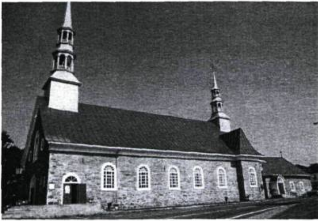
L'église de Saint-Jean-Port-Joli.