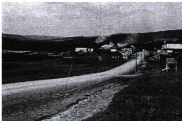
Scène rurale de la région du Témiscouata.

L'autre solidarité, dite «artificielle», se caractérise plutôt par une entité administrative et il est rare qu'une personne ait le sentiment profond d'y appartenir et de s'y identifier. C'est la déli-