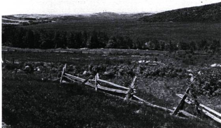
Vue panoramique du lac Témiscouata.

les mêmes intérêts, les mêmes buts, crée une solidarité et une force commune aboutissant obligatoirement à des réalisations constructives et profitables pour l'ensemble de la région et de la société québécoise.