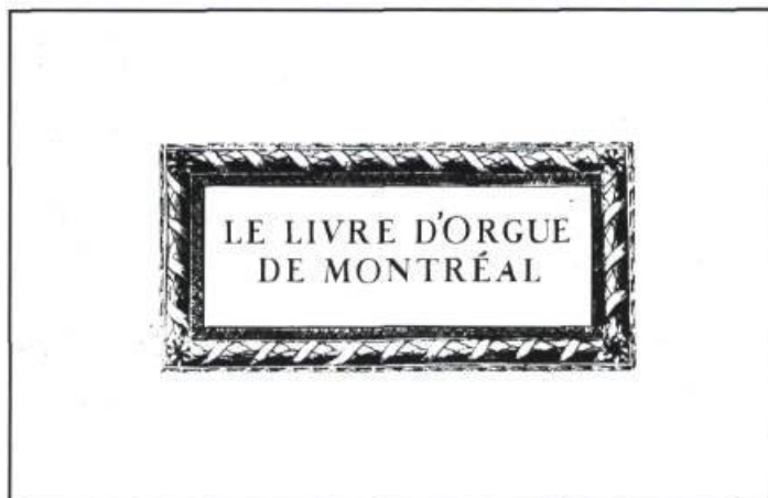
Page couverture du Livre d'orgue de Montréal de Jean Girard.

Le rappel de l'existence de la communauté des Notaires de Tournai conduit