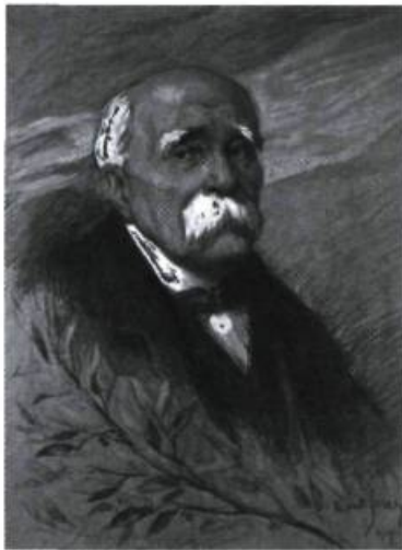
Georges Clemenceau (1841-1929).

ses ordonnances du Gouvernement du Général de Gaulle la réorganiseront, en reconnaissant son rôle essentiel. Pour lui permettre de l'exercer plus aisément seront enfin créées en 1967 les Sociétés Civiles Professionnelles, instaurant le principe «un seul office notarial, plusieurs notaires».