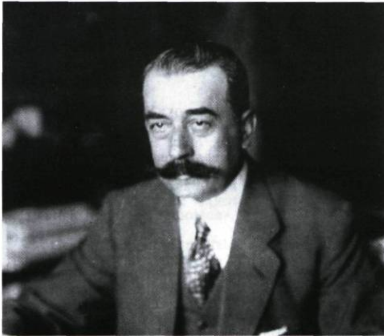
Étienne Clémentel [1864-1936], notaire à Riom et ministre des Finances.

ressortissants de plusieurs nations aux législations différentes? Pourtant le champ contractuel qui s'ouvre ainsi, et où œuvrent déjà avec des bonheurs certains d'autres juristes, devrait pouvoir bénéficier de la