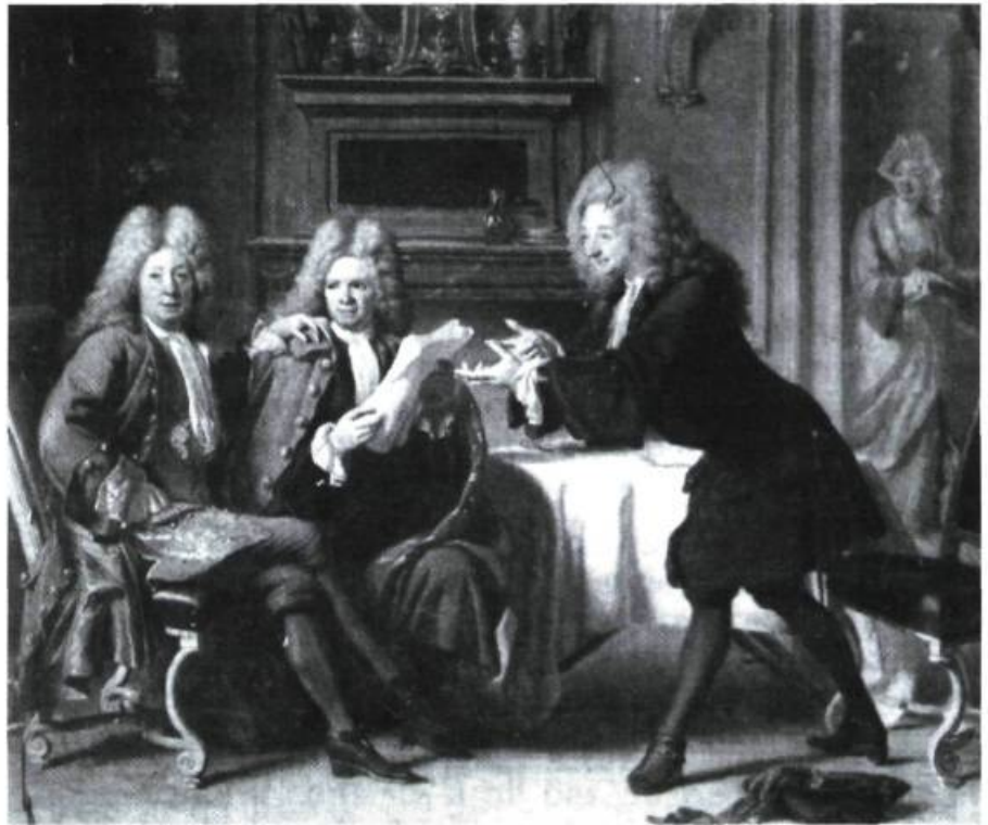
Avant la signature d'un contrat. Toile du XVII e siècle.

Quelques exemples le prouvent. Ainsi, il a toujours pratiqué la «négociation immobilière», mettant en présence le ven-