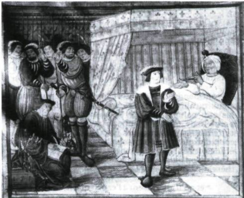
Homme dictant son testament. Miniature de XV e siècle.

La France, fille de Rome, optera à son tour pour le recours au Notariat, par trois voies :