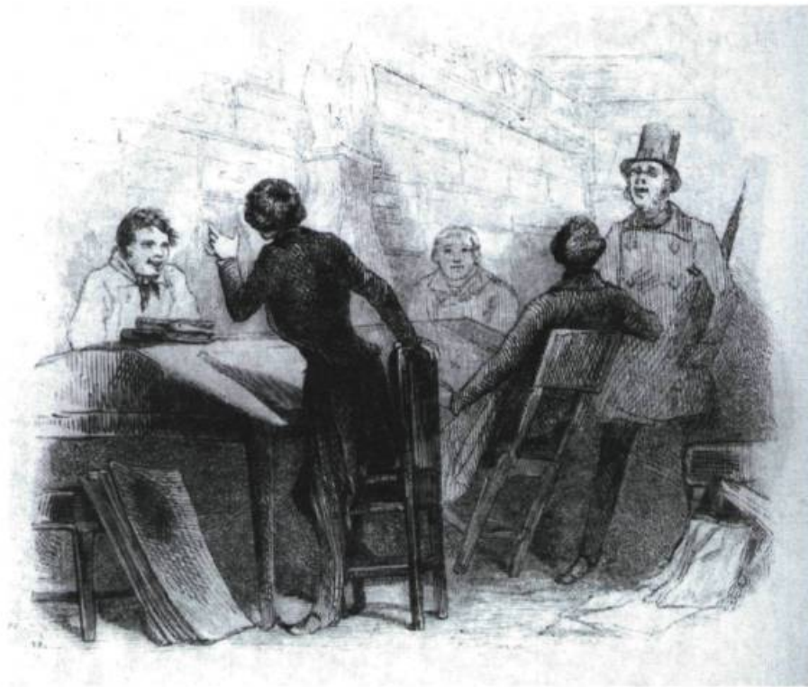
Étude de notaire. Gravure datant de 1843.

Il doit être indiqué, incidemment, que de nombreux notaires sont administrateurs de Caisses d'Épargne françaises. Il y aurait à ce sujet à faire une étude comparative avec le rôle que jouent les notaires québécois auprès des Caisses Populaires Desjardins.