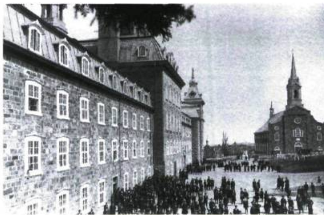
Cour avant du Collège de Sainte-Anne en 1916.

Et au collège, dans ce cher collège, quel deuil immense, quel vide irréparable?