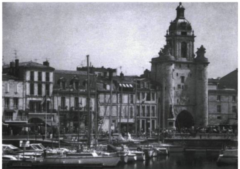
Le port de La Rochelle et la porte de la Grosse Horloge.

Et dans les vieilles rues de La Rochelle, quelle n'avait pas été notre surprise de voir flotter au vent quelques drapeaux du Québec. Nous avons l'impression d'arriver dans un pays que nous n'avions jamais quitté. C'était en mai 1989. Déjà.