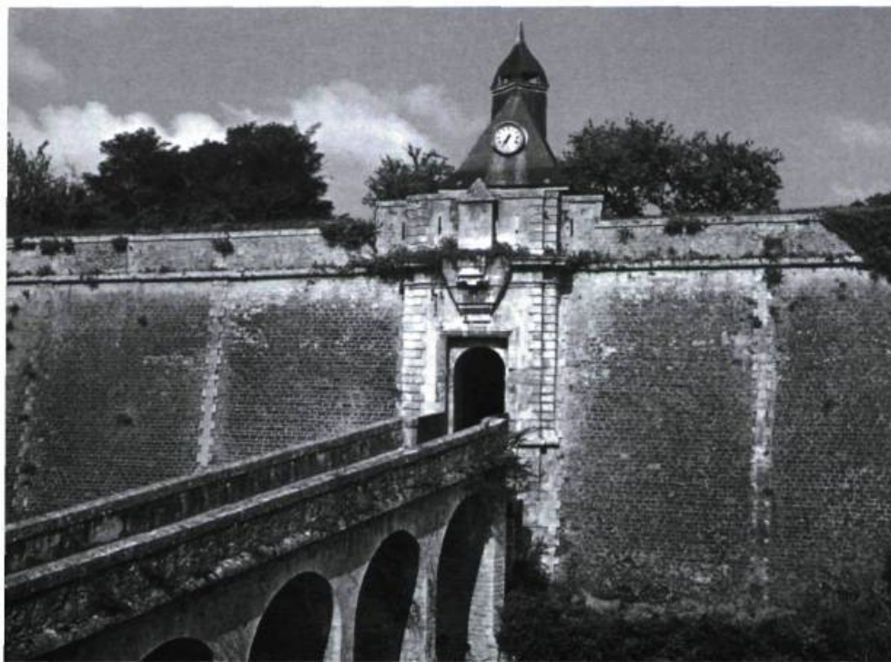
La Porte de la Citadelle de Blaye

gnies d'où proviennent ces douze hommes, d'autre part, leur nom, surnom et nom de guerre, enfin le lieu de leur naissance et leur âge, ainsi que leur taille et la date de leur entrée en service.