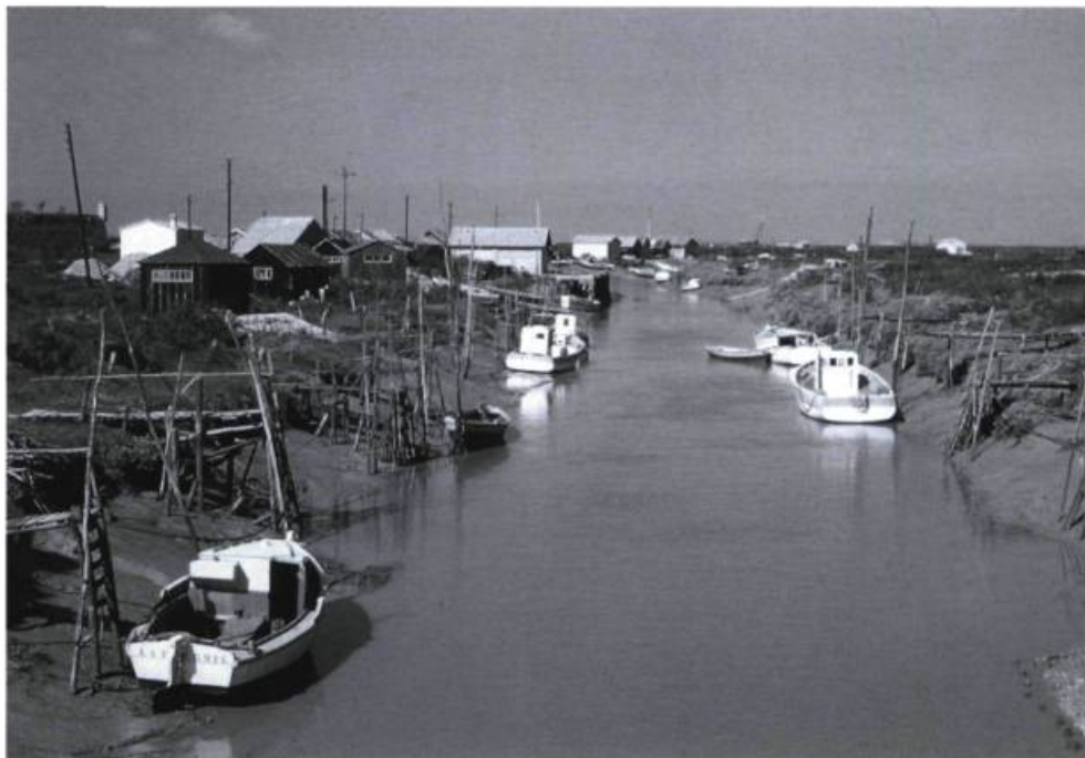
Les dernières traces d'un grand port.

Louis XIV avait fait la connaissance de la belle Marie alors qu'il avait rendu visite à sa mère, Madame Hiéronyme Mancini, la sœur du cardinal Mazarin. La jeune Marie étudiait alors les belles lettres. À