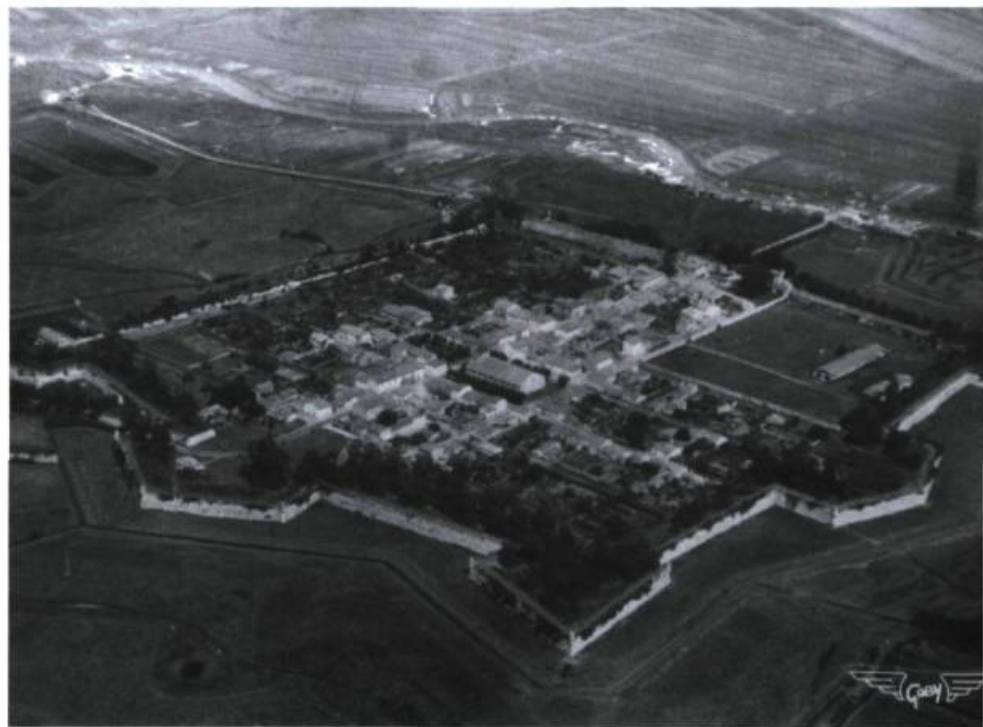
Vue aérienne de Brouage.

Brouage ne se distingue pas uniquement par son histoire. Son site remarquable et exceptionnel dans les anciens marais salants saintongeais lui confère une partie de sa renommée. Mais c'est aussi cette situation qui lui a valu des destinées diverses. Les basses terres de Brouage sont devenues depuis fort longtemps des «marais