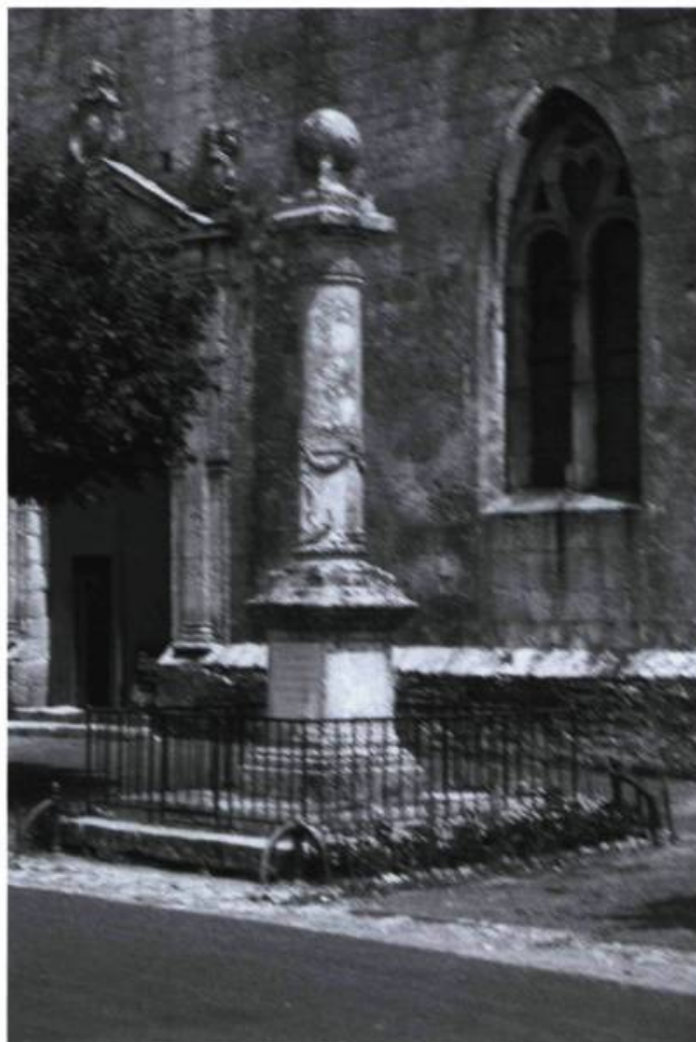
Un bien modeste monument pour un grand homme.

tre de ses enfants. Brouage a deux pays: la Saintonge et le Québec.