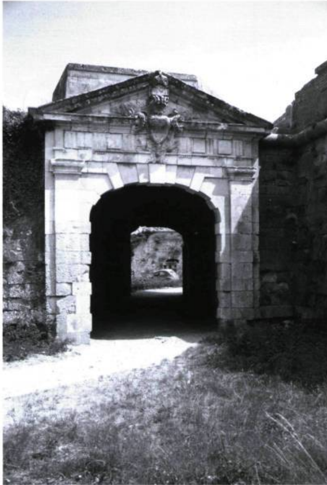
Cette vieille porte d'entrée à Brouage rappelle Louisbourg.

de trois compagnons. Il n'avait pas oublié Marie. La preuve en est qu'il demanda à habiter dans la même chambre qu'elle avait occupée. Et lui aussi, au soleil tom-