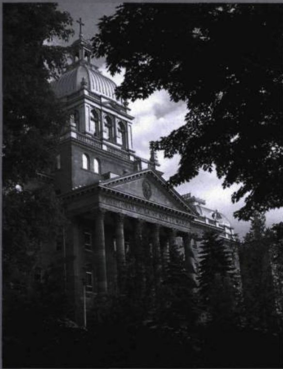
Portail monumental du pensionnat du Saint-Nom-de-Marie érigé en 1905.