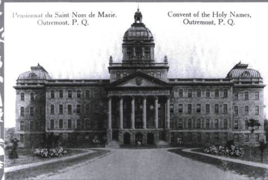
Pensionnat du Saint-Nom de Marie, Outremont.