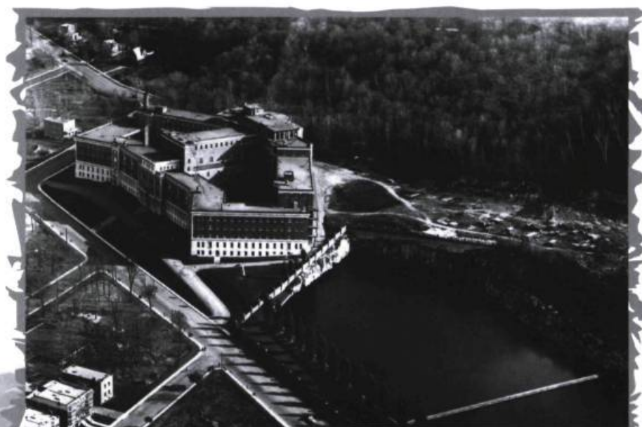
Maison mère de la communauté vers 1930 à côté du réservoir d'eau Bellingham.

De son côté, le pensionnat recueille l'école de musique Vincent-D'Indy en 1981 et transforme sa chapelle en salle de concert sous le nom de