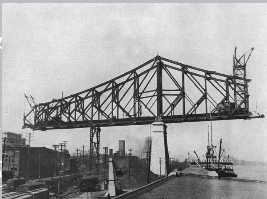
Construction en cantilever, pilier n° 25 dans le port, en 1928.

Pendant cette même période – 1910-1920 –, le port de Montréal connaît aussi une croissance extraordinaire. Même s'il est fermé à la navigation quelques mois par année, il demeure le deuxième port en importance en Amérique du Nord, juste après New York. Des hommes d'affaires influents évoquent la possibilité d'étendre les activités du port à la rive sud. La construction d'un nouveau pont, qui permettrait de faciliter le transport des marchandises d'une rive à l'autre, devient de plus en plus une priorité. Il y a cependant une contrainte incontournable : la navigation et les activités du port ne doivent pas être perturbées par la mise en marche de ce nouveau chantier.