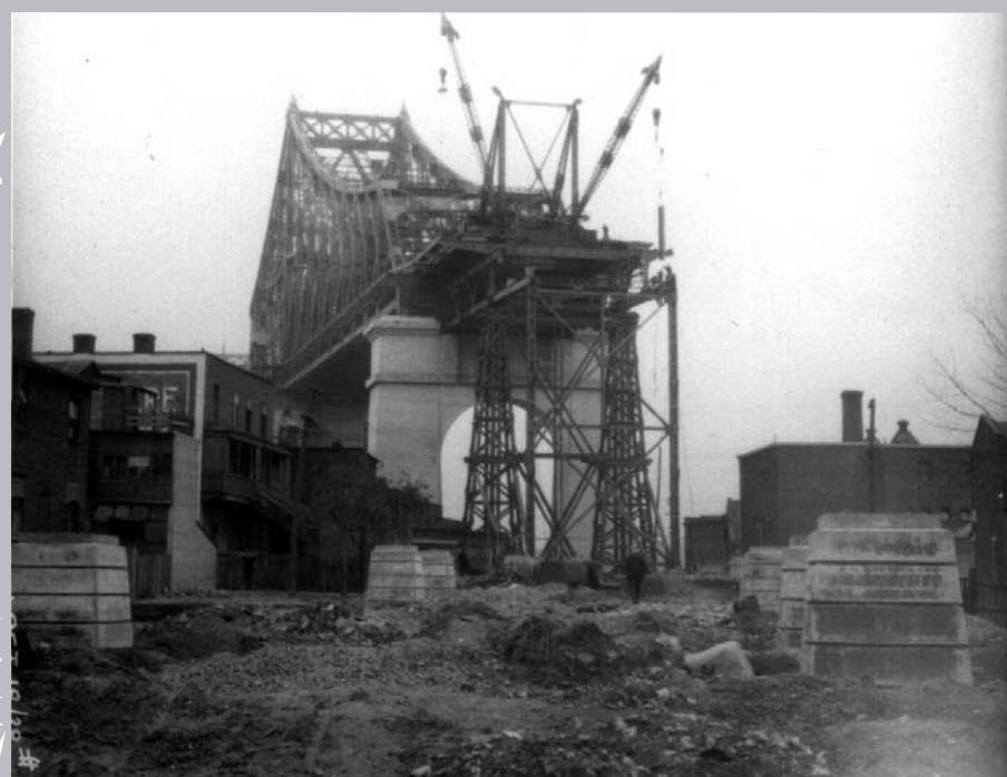
La construction du pont ouvre une brèche dans le tissu urbain.

Plus tard, en 1880, c'est la proposition Schearer qui retient l'attention. Chaque printemps, le port de Montréal est exposé aux crues printanières et, afin de protéger les installations portuaires contre les glaces, les autorités élaborent le projet d'une digue s'avancant dans le fleuve, à partir de laquelle un pont serait construit et traverserait le fleuve jusqu'à Longueuil en prenant appui sur la partie ouest de l'île Sainte-Hélène. Seule la digue sera construite.