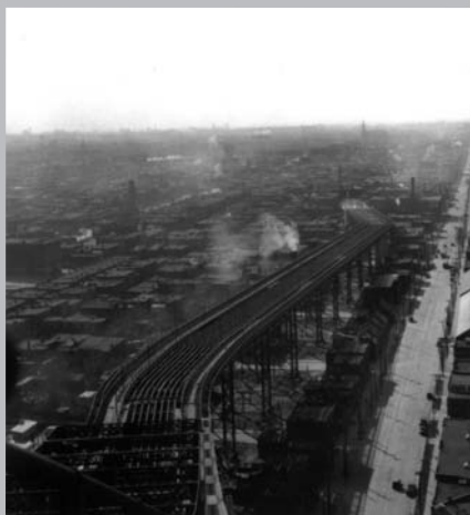
L'approche nord s'enfonce profondément dans le quartier Sainte-Marie.