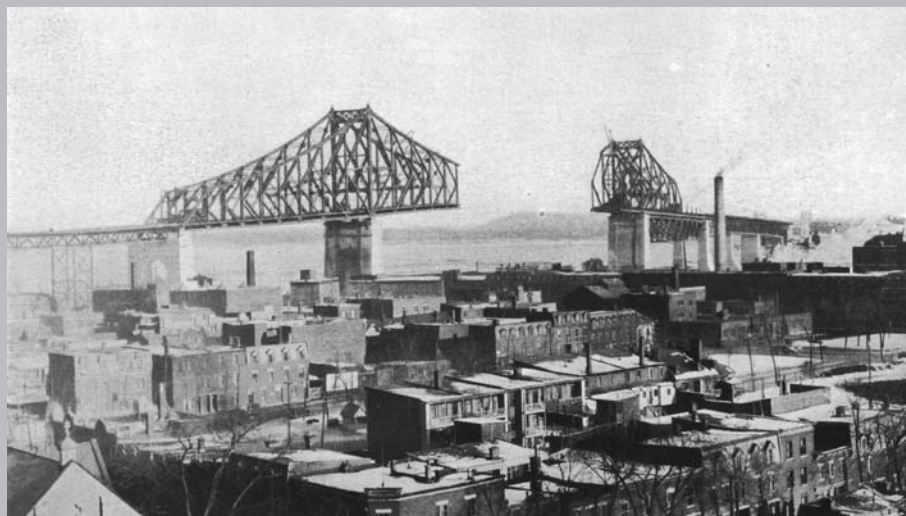
Les structures au-dessus du fleuve.

La deuxième section est celle de la travée centrale. La superstructure d'acier mesure au total 590,4 mètres. Au-dessus du fleuve, une distance de 334,4 mètres sépare le pilier 25 situé dans le port, du pilier 24 qui repose au fond de l'eau, du côté de l'île Ronde. Le dégagement entre le pont et les installations portuaires est de 47,5 mètres, alors que la distance qui sépare le pont de la surface du fleuve atteint près de 50 mètres.