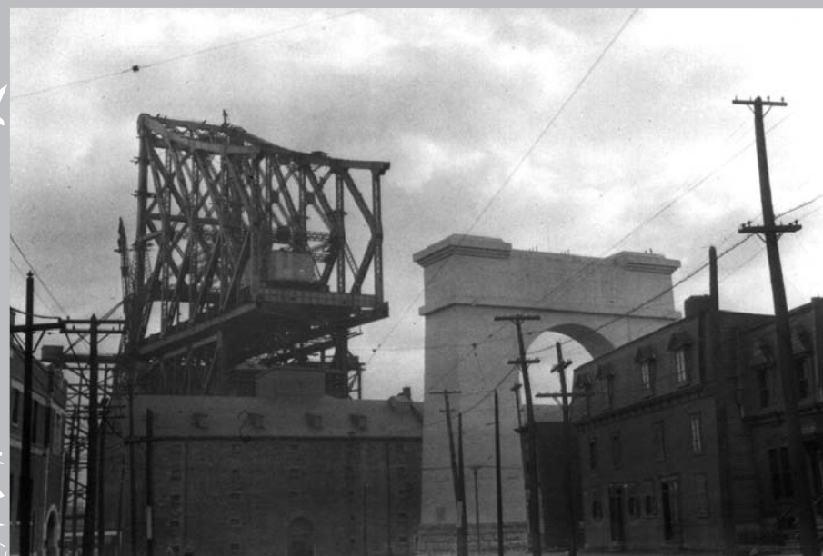
La construction du pont entraîne de nombreuses démolitions dans le quartier Sainte-Marie.

La région entourant Montréal se développe elle aussi et la ville se retrouve au centre d'un marché en pleine croissance. Les petits commerçants des villages environnants visitent régulièrement les grands magasins-entrepôts afin de trouver les marchandises qu'ils pourront écouler dans leur localité. Les cultivateurs s'y rendent aussi pour