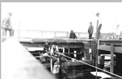
Le 28 mai 1933, au cours de la construction du pont du lac Saint-Louis entre Kahnawake et LaSalle : descente d'un scaphandrier pour l'examen du lit de la rivière; à l'arrière plan, vue du pont Saint-Laurent, propriété du Canadien Pacifique.

utilisée par les usagers bien que le site demeure un emplacement d'embarquement des passagers. Depuis le début de 2000, l'un des services de trains de banlieue entre Montréal et la Rive-Sud emprunte le pont ferroviaire du Canadian Pacifique. Le 17 février 2006, la ligne entre Montréal et Delson-Candiac est temporairement interrompue à cause du déraillement de six wagons d'un train de marchandises. Le vent avait renversé les voitures, rendant délicates les opérations de dégagement de la voie ferroviaire. Le service fut rétabli après trois semaines 6 . Aujourd'hui, quelque 1200 usagers utilisent quotidiennement cette ligne du train de banlieue.