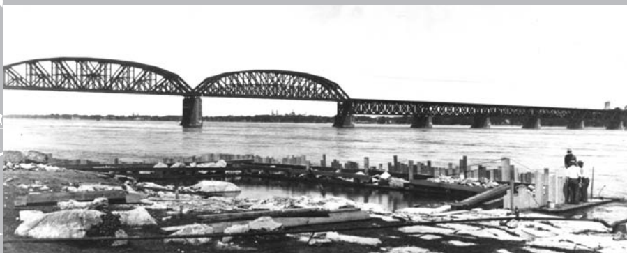
Le 22 juin 1933, à l'avant plan, travaux préliminaires pour le pont du lac Saint-Louis entre Kahnawake et LaSalle; construction du batardeau, à l'arrière plan; vue du pont Saint-Laurent.

utilisée par les usagers bien que le site demeure un emplacement d'embarquement des passagers. Depuis le début de 2000, l'un des services de trains de banlieue entre Montréal et la Rive-Sud emprunte le pont ferroviaire du Canadian Pacifique. Le 17 février 2006, la ligne entre Montréal et Delson-Candiac est temporairement interrompue à cause du déraillement de six wagons d'un train de marchandises. Le vent avait renversé les voitures, rendant délicates les opérations de dégagement de la voie ferroviaire. Le service fut rétabli après trois semaines 6 . Aujourd'hui, quelque 1200 usagers utilisent quotidiennement cette ligne du train de banlieue.