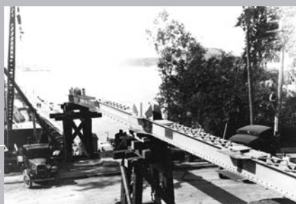
Le 6 septembre 1933, lors de la construction du pont du lac Saint-Louis entre Kahnawake et LaSalle: première pièce d'acier en place, travée n° 2 au-dessus du boulevard LaSalle à LaSalle.

En 1958-59, la Voie maritime du Saint-Laurent décide de faire surélever la voie sud du pont, respectant ainsi la hauteur exigée par les responsables de la navigation. Pour répondre à la circulation toujours croissante de véhicules, le ministère des Travaux publics convient de construire un second pont, en aval du premier et d'une longueur comparable. Les coûts s'élèvent à 1,5 million de dollars et engagent des travaux qui seront complétés en août 1963. Depuis cette date, le pont compte quatre voies, les deux nouvelles en direction de LaSalle et les deux plus anciennes en direction de Kahnawake 12 .