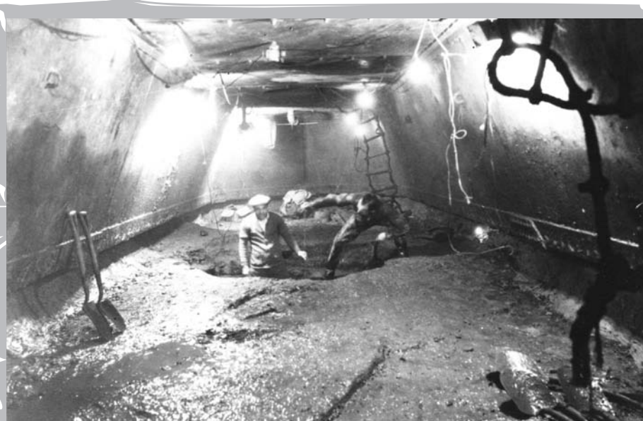
Le 24 juin 1933, lors de la construction du pont du lac Saint-Louis entre Kahnawake et LaSalle : vue de la partie aval du compartiment de travail dans le caisson n° 5, au moment de l'inspection finale du roc à cet endroit.