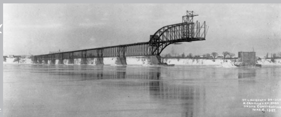
Gare du Highlands et voie ferrée à proximité du pont Saint-Laurent en 1918, alors protégé par les militaires.

Entre 1910 et 1913, afin d'accommoder le transit sans cesse grandissant, le pont Saint-Laurent voit sa superficie doubler, assurant du même coup un meilleur service 4 . Au cours des guerres 1914-1918 et 1939-1945, la localisation de la gare du Highland à proximité d'un pont ferroviaire est, en fait, un point militaire stratégique. Le matériel de