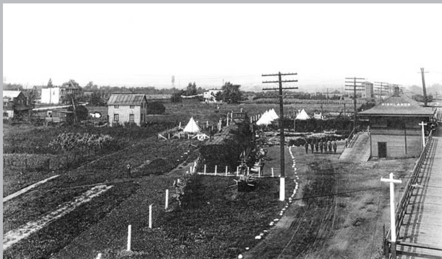
Construction du pont Saint-Laurent, propriété du Canadien Pacifique, en 1887.

À la fin du XIX e siècle, la municipalité de la paroisse des Saints-Anges de Lachine, à ne pas confondre avec la ville de Lachine, assiste à l'arrivée du chemin de fer sur ses terres. Au cours des années 1880, le Canadien Pacifique souhaite briser le monopole détenu par la compagnie du Grand Tronc, propriétaire depuis 1860 du pont Victoria, le seul qui enjambe le fleuve Saint-Laurent à cette époque. Pour ce faire, le Canadien Pacifique met de l'avant le projet de construction d'un pont qui relierait Montréal à la Rive-Sud. Plusieurs sites sont alors envisagés. Pour un coût d'exécution moins élevé grâce à la proximité des deux rives, l'emplacement retenu correspond, sur la Rive-Sud, à la réserve amérindienne de Kahnawake et, sur la Rive-Nord, à la municipalité de la paroisse de Lachine (aujourd'hui l'arrondissement de LaSalle de la Ville de Montréal).