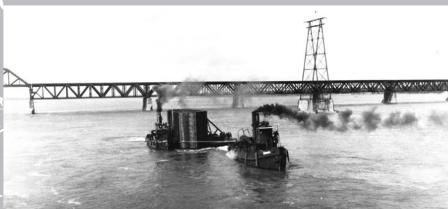
Le 29 septembre 1933, lors de la construction du pont du lac Saint-Louis entre Kahnawake et LaSalle : caisson arrivant tout assemblé de l'usine de la compagnie Dominion Bridge de Lachine; à l'arrière plan, le pont Saint-Laurent du Canadien Pacifique.