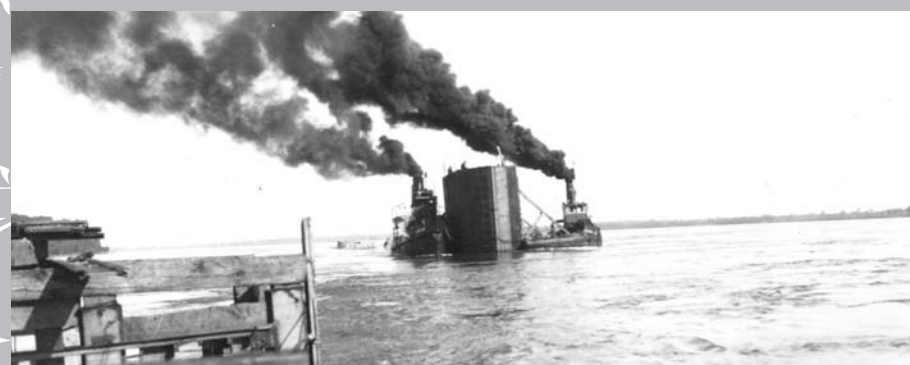
Le 18 août 1933, lors de la construction du pont du lac Saint-Louis entre Kahnawake et LaSalle : un caisson, remorqué par deux bateaux, approchant le site d'enfoncement.