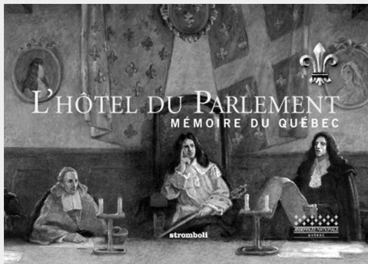
Couverture du livre L'Hôtel du Parlement, mémoire du Québec .

M. Deschênes, ce fut pour moi un réel plaisir de bavarder pendant quelques heures avec vous. Je tiens à vous féliciter très sincèrement pour toutes ces années consacrées à la diffusion de l'histoire.