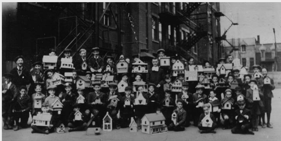
Concours de maisonnettes d'oiseaux, Cercle de l'école Sainte-Brigide à Montréal en 1940.