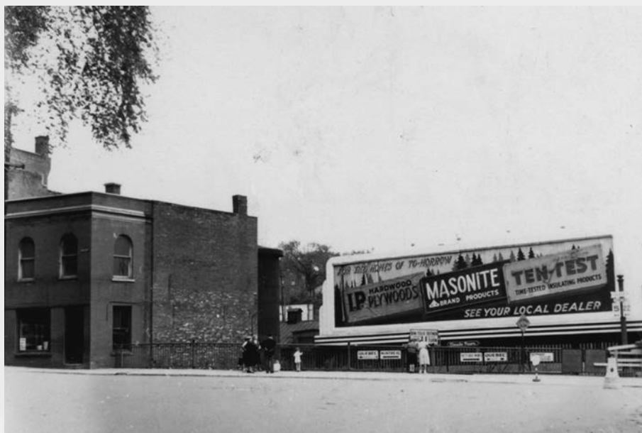
"For the homes of to-morrow", publicité affichée à l'intersection des rues Wellington Nord et Frontenac en 1954.

Il y a également un certain nombre de causes plus prosaïques, comme l'accès aux sources. L'histoire se fait à l'aide de documents de toutes sortes et les grandes entités ont tendance non seulement à en produire plus, mais elles disposent également des ressources nécessaires pour les conserver et les rendre facilement accessibles. Dans les petites localités, les choses sont souvent plus aléatoires. Le chercheur dépend alors de la bonne volonté de l'archiviste qui est en poste ou alors du dynamisme des associations locales et, au premier chef, des sociétés d'histoire. Ajoutons que, si on se fie aux bilans que j'ai évoqués plus tôt, chercheurs et étudiants sont plus enclins à étudier ce qui est