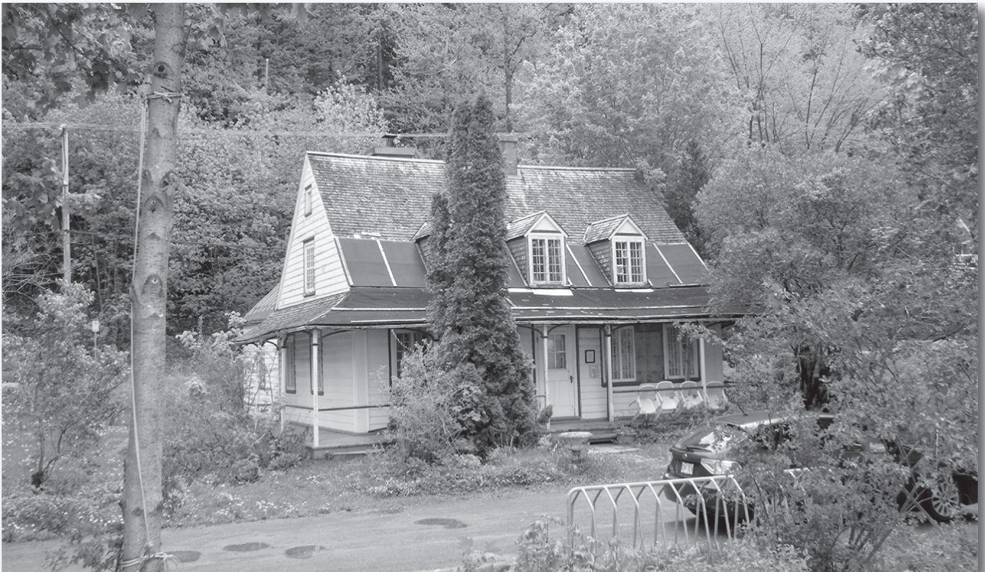
Vue générale de la maison natale de Louis Fréchette, en attente de sa restauration au printemps 2013